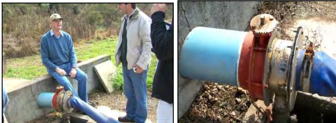
Figura 20.- Rampa de carga y detalle de la llave que permite la salida del biofertilizante hacia la manguera de carga

Desde el depósito del biofertilizante sale una cañería que recorre unos 100 metros, lugar en dónde se encuentra la zona de carga de la estercolera (ver esquema). Esta cuenta con una rampa, una llave esclusa, una manguera de gran diámetro, una cámara receptora de los excedentes de la manguera y un depósito para acopiar el biofertilizante que queda en la manguera luego de la carga de la estercolera.