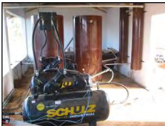
Figura 12.- Compresores dentro de la construcción anexa al biodigestor. Estos compresores se encargan de mantener y regular la presión del biogás para la recirculación y para la red de consumo de la colonia. A la derecha de la figura se observan las columnas de destilación para retener el agua siempre presente en el biogás y los reguladores de presión de gas para proteger la red de gas. Este equipo es también el encargado de hacer recircular el biogás, proveniente del biodigestor secundario, a presión dentro del biodigestor primario.

En la sala de máquinas cercana al biodigestor principal, entre otros elementos, hay 3 compresores. Dos son utilizados para comprimir el gas en un depósito externo y uno para mandar el gas a la red interna del establecimiento.