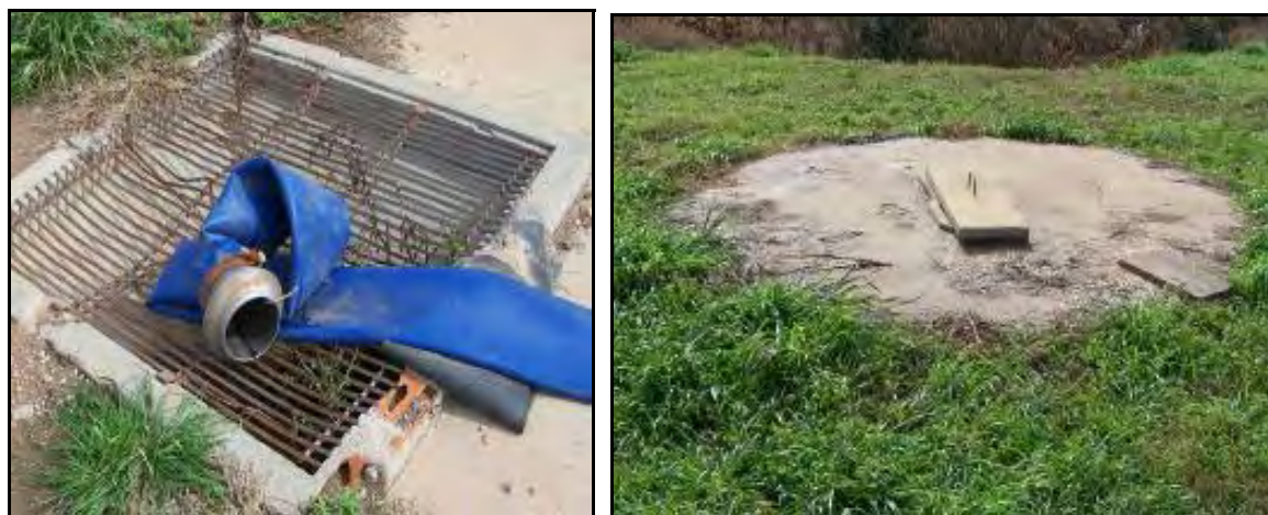
Figura 21: Una vez cargado el equipo con biofertilizante la manguera se coloca sobre la cámara que muestra la foto de la izquierda. Esta cámara esta conectada al depósito (de hormigón armado) que esta a unos 10 metros de distancia. En este depósito se almacena el biofertilizante que queda en la manguera luego de la carga. Cuando este depósito se llena, con una bomba conectada a la toma de fuerza del tractor se carga la estercolera. En Granja "Marujo" se trata por todos los medios evitar la contaminación del ambiente con los efluentes.