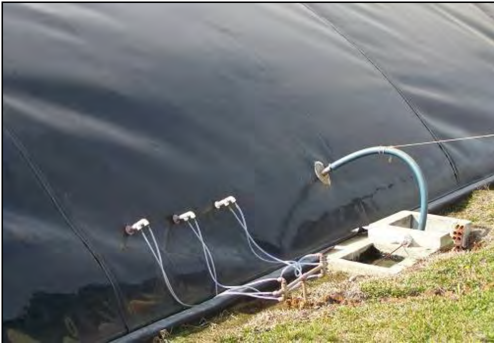
Figura 15.- La foto muestra la entrada de 3 de las 6 mangueras que inyectan oxígeno al biodigestor primario. La manguera de mayor diámetro es la que conduce el biogás al compresor para que lo comprima en un depósito externo. Desde este depósito se manda el biogás a la red que lo distribuye en el establecimiento.

A continuación del digestor primario, tal cual lo muestra el esquema, se encuentra el digestor secundario que, como dijéramos produce biogás pero no se consume sino que se utiliza para agitar el fondo del digestor primario. A continuación del secundario se encuentra el depósito del biofertilizante que también genera algo de biogás que tampoco se consume.