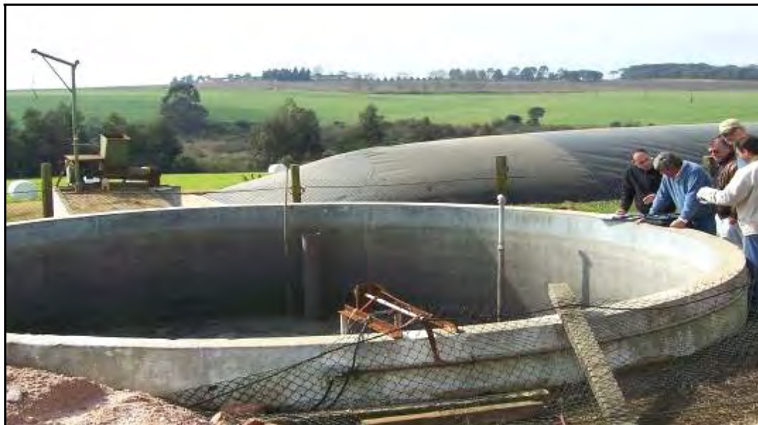
Figura 3.- Vista general del depósito receptor de efluentes. Del lado opuesto al agitador hay una bomba que manda los efluentes cada 2 días al digestor principal que se encuentra, como se observa, muy cercano.

Hacia atrás del depósito y en la punta del digestor se encuentra un guinche manual y una moledora sobre una rampa que se acciona con la toma de fuerza de un tractor. En la granja "Marujo" no se tira ningún residuo. A esta moledora van a parar todos animales que mueren para luego introducirlos al digestor, que según el propietario en 2 ó 3 días se degrada casi por completo.