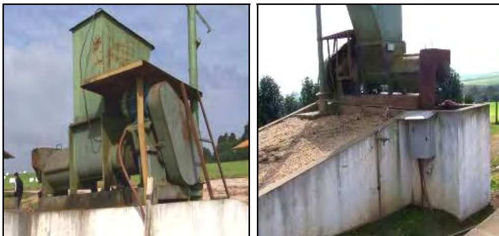
Figura 4.- Moledora de animales muertos que luego se introducen en el digestor.

Hacia atrás del depósito y en la punta del digestor se encuentra un guinche manual y una moledora sobre una rampa que se acciona con la toma de fuerza de un tractor. En la granja "Marujo" no se tira ningún residuo. A esta moledora van a parar todos animales que mueren para luego introducirlos al digestor, que según el propietario en 2 ó 3 días se degrada casi por completo.