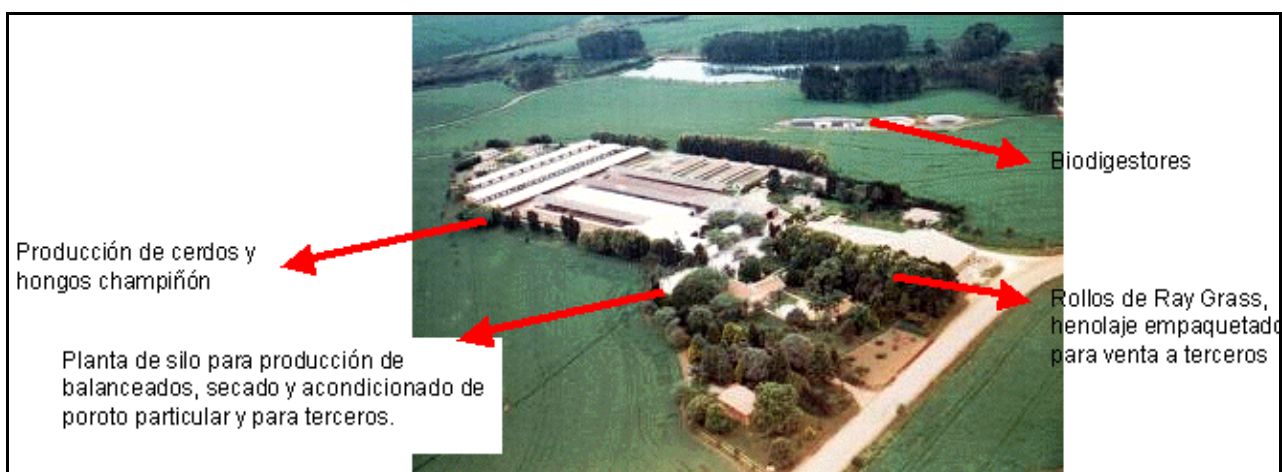
Figura 0.- Vista aérea del establecimiento "Marujo" (750 ha), con producción porcina, de hongos champiñón y producción de bioenergía a partir de gas metanol. Total 12 familias y 90 empleados, una relación de 1 empleado cada 8,3 ha.

La granja Marujo posee, además de su superficie dedicada a la producción agrícola, una producción de alta eficiencia de cerdo, 850 madres porcinas, con terminación en tres etapas. El establecimiento posee 750 has y los residuos producidos por los animales (NPK fertilizante líquido), poseen un valor estimado de 200.000 R$/año (U$$ 115.000). También se adosa el emprendimiento de producción de hongos champiñón que produce con la fermentación de los residuos y desechos (cama) y el agua caliente que hace pasar por los caños mediante serpentinas, agua caliente que genera a partir del biogás. Producción altamente diversificada y de alto valor agregado. El desecho obtenido de la producción porcina es utilizado como combustible para un biodigestor que produce gas metanol. Este gas metanol es procesado para sustituir al gas licuado y a la energía eléctrica consumida en la colonia con alto ahorro monetario. Además el biodigestor produce biofertilizante para los cultivos del establecimiento. Todo constituye una alta eficiencia productiva y una muy buena gestión ambiental, ya que con los efluentes se produce biogás, bioenergía eléctrica y biofertilizante líquido.