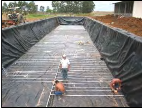
Figura 6.- Instalación de las mangueras de recirculación de biogás en el fondo del digestor principal. Esta recirculación de gas desde el fondo del digestor favorece el ciclo de producción de metanol y evita la deposición de sólidos en el fondo del digestor. Obsérvese la capa aislante contra el piso de tierra. Este recubrimiento es una lona especial que tiene una vida útil de más de 20 años.