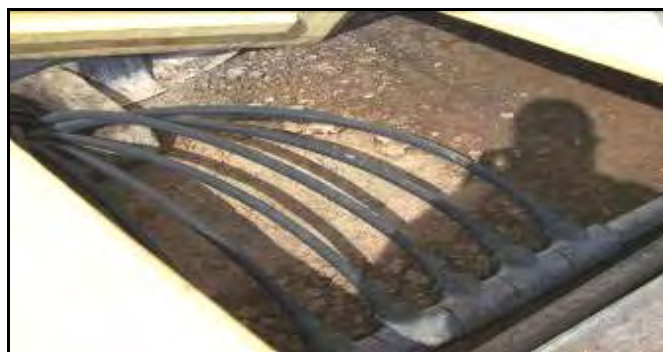
Figura 8.- Vista de la entrada de agua caliente proveniente de la refrigeración del motor co – generador de energía eléctrica que se encuentra en la sala de maquinarias al costado del digestor principal. La entrada de la cañería plástica es por la punta del digestor.

La lona plástica que cubre el fondo de la fosa y las paredes laterales es termo sellada con la lona plástica que cubre el digestor superficialmente en el cordón con forma de "U" sobre el cual se deposita agua de lluvia para mantener más firme la lona plástica. De esta forma queda totalmente hermético el interior del biodigestor. La vida útil de la lona plástica es de aproximadamente 20 años.