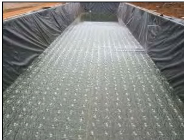
Figura 7.- Sistema de recirculación de biogás en funcionamiento, previo llenado del digestor con una capa de agua. La foto muestra la prueba del sistema antes de ser llenado y tapado, el burbujeo del gas o presión es lo que muestra la foto.