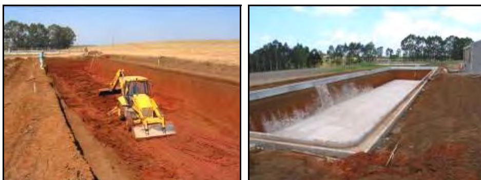
Figura 5.- Construcción del digestor principal para almacenamiento de los residuos primarios del establecimiento y generación y captación del gas metano. Se observa el cordón en forma de "U" y la capa de arena sobre la cual se coloca la lona plástica para impermeabilizar la fosa.

Sobre la lona plástica se coloca un sistema de cañerías (galvanizada) cuyo objetivo es circular gas metano desde abajo hacia arriba. Esta recirculación de gas (que proviene del digestor secundario) desde el fondo del digestor, favorece el ciclo de producción de metano y evita la deposición de sólidos en el fondo del digestor, como así también la formación de costras en la superficie de la fosa.