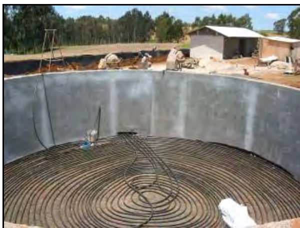
Figura 1.- Vista de la construcción del depósito en dónde llegan todos los efluentes de los galpones de cerdos.

El objetivo de concentrar los efluentes en un depósito previo a la entrada al digestor, es homogeneizar y oxigenar los efluentes mediante la utilización de un agitador a paletas. Luego una bomba los manda al digestor principal.