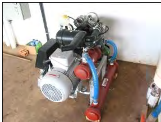
Figura 13: Motor de gasolina que funciona con biogás para transformarlo en Bioelectricidad. Economía mensual estimada en el consumo de energía eléctrica de 3.000 R$, o sea 1.700 US$/mes de ahorro de energía eléctrica. Como se puede ver es un motor naftero, marca Audi, adaptado para funcionar a biogás, tiene acoplado un generador de electricidad. Como se observa el motor no dispone de radiador, el agua de refrigeración del motor es la misma que recircula por la cañería que calienta el fondo del biodigestor (aprovechamiento total de la energía para eficientizar el sistema de manera integral).

Otro equipo que se encuentra en esta sala es el motor co – generador de energía eléctrica. Es un motor naftero que funciona a gas metano y que genera electricidad que es utilizada en Granja "Marujo". Siempre se trata de generar la menor cantidad de electricidad posible a partir de gas metano, pues es un proceso no muy eficiente y por otra parte la generación de electricidad a partir de este co – generador es la que más tiempo hay que dedicarle en cuanto a dedicación para el mantenimiento.