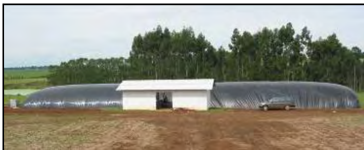
Figura 11.- Vista externa del digestor en pleno funcionamiento con su capa plástica protectora externa inflada por el biogás. En primer plano la sala donde se ubican los compresores, reguladores de presión, bombas inyectoras de oxígeno, filtros y motores eléctricos.

El principal objetivo en Granja "Marujo" es obtener energía a partir de gas metano y tratar de convertir lo menos posible el gas en energía eléctrica. Hay épocas en las cuales el gas generado no alcanza (época de secado de granos) y épocas en las que no se llega a consumir todos el gas generado por el biodigestor. Jan Haasjes recomienda, en este caso, ventearlo y no almacenarlo, pues comprimir el gas para acopiarlo es muy costoso.