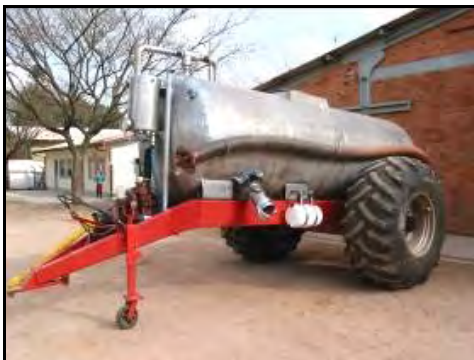
Figura 19.- Equipo que se utiliza para esparcir el biofertilizante. Obsérvese que el tanque es de acero inoxidable, de plástico no resistiría la presión. La capacidad operativa de este equipo es de 10 ha por día.

Según los análisis químicos que realizó Jan Haasjes de los efluentes de su granja y los valores que encontró luego de una revisión bibliográfica sobre el contenido de nutrientes de efluentes de distintas granjas similares al sistema que él utiliza, los valores promedio con los que se maneja son: Nitrógeno: 6.8 kg/m 3 , Fósforo: 3.03 kg/m 3 y Potasio: 2.52 kg/m 3 . Estos valores son del efluente antes del ingreso al digestor. El contenido de fósforo y potasio no cambian la concentración luego del proceso de biodigestión, el nitrógeno cambia la concentración pero, según comenta, muy poco.