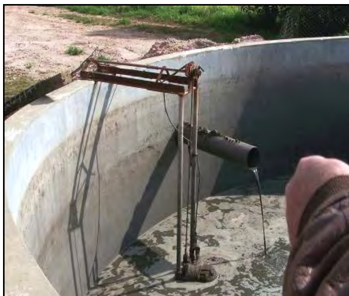
Figura 2.- Vista actual del depósito receptor de los efluentes. Se puede observar el caño que conduce los efluentes desde los galpones hacia el depósito y el agitador a paletas.

Cuando se construyó este depósito se instaló en el fondo una cañería en forma de serpentina para inyectarle aire a los efluentes y provocar la homogeneización. Luego de algunas pruebas iniciales se concluyó que esto no era necesario y con sólo el agitador a paletas era suficiente.