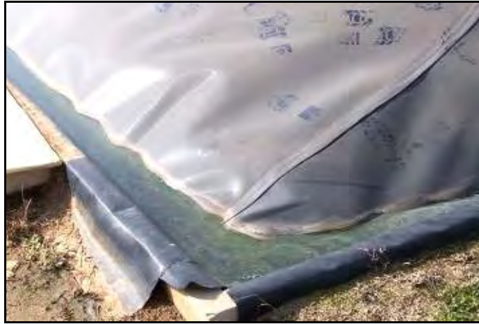
Figura 9.- Detalle del sellado de la lona interna y externa del biodigestor.

Lo ideal es que el efluente que ingresa al biodigestor tenga la menor cantidad de agua posible. Por este motivo Jan Haasjes recomienda utilizar para el lavado de los galpones de cerdos, alta presión para disminuir el volumen de agua. Otra medida que recomienda es la utilización de bebederos chupete en el comedero y no bebedero chupete separados del comedero. El porcentaje de materia seca del efluente, para la Granja "Marujo" depende si proviene del galpón de madres o del galpón de cerdos en engorde, siendo de 3 – 4% y 6 – 7% respectivamente. El pH del efluente, lo ideal, debe ser de 7 y en lo posible constante.