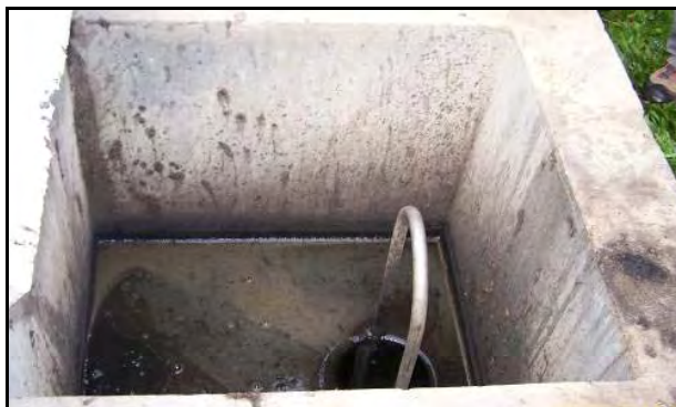
Figura 17.- Cámara que actúa por rebalse. Se accionan cuando se carga el digester primario. Este tipo de cámara se encuentra al costado de los galpones de cerdos, conectadas a las fosas de los galpones. Por el mismo sistema (gravedad) se carga el depósito de efluentes antes de la entrada al digester primario.

Los dos digestores y el depósito de biofertilizante están conectados y entre ellos con una cañería y una cámara que actúa por rebalse. Cuando se carga el digester primario se abren las cámaras para que el efluente procesado pase del digester primario al secundario y de éste al depósito de biofertilizante.