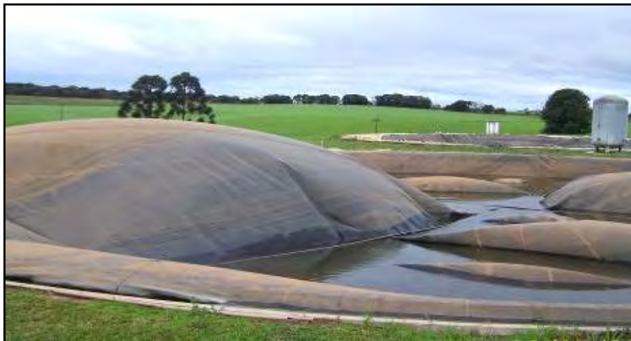
Figura 16.- Vista del digester secundario y detrás el depósito de biofertilizante. Ambos construidos en forma circular con un cordón de hormigón armado en forma de "U" y revestidos internamente y externamente, al igual que el digester primario, con una lona plástica. Entre medio de ambos se observa un depósito de biogás que se comprime y luego se manda al fondo del digester primario para agitar, evitando la sedimentación y la formación de costras.

Los dos digestores y el depósito de biofertilizante están conectados y entre ellos con una cañería y una cámara que actúa por rebalse. Cuando se carga el digester primario se abren las cámaras para que el efluente procesado pase del digester primario al secundario y de éste al depósito de biofertilizante.