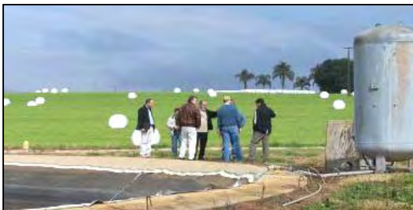
Figura 18.- Vista parcial del depósito de biofertilizante. A la derecha de la foto el depósito de biogás que genera este y que utiliza para la agitación del digester primario.