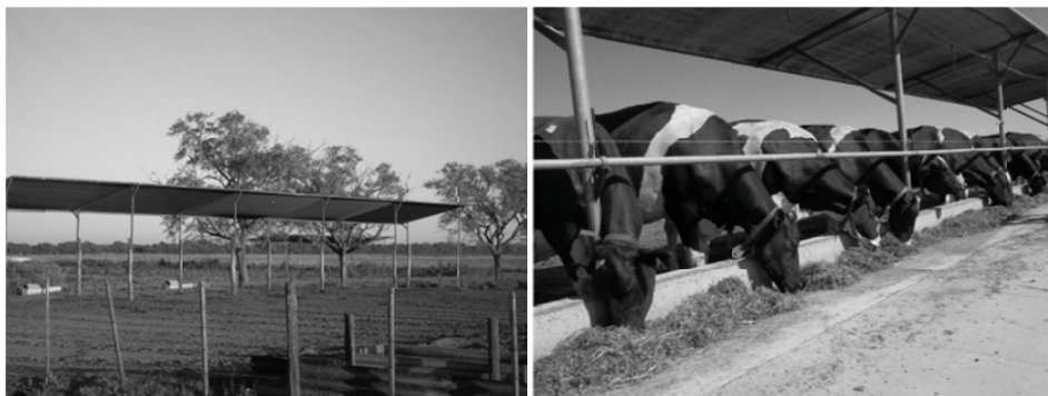
Fig. 1: Corral de estabilización donde fueron alojadas las vacas secas durante el verano 2014