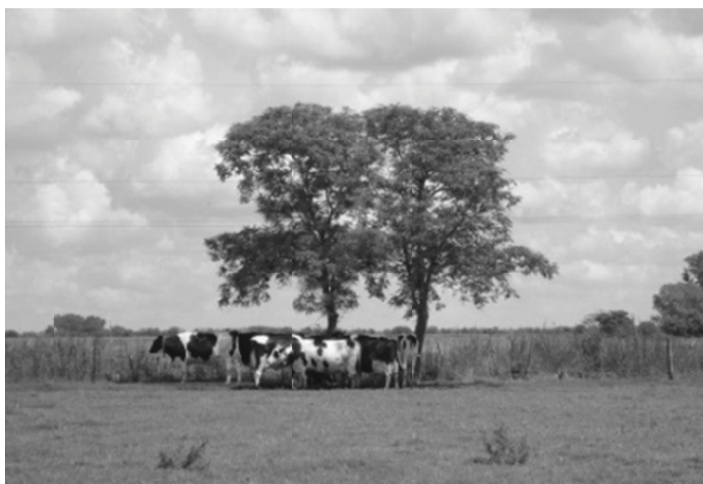
Fig. 2: Corral donde fueron alojadas las vacas secas, transitoriamente, para permitir el secado de los corrales después de las copiosas lluvias

Tabla 1: Composición de la dieta, expresada en kg de materia seca por vaca seca por día (kg MS /VS/d) para animales entre 60 a 30 días de la fecha probable de parto. Composición química de los alimentos de la dieta de Vacas Secas. Los valores están expresados en base seca. materia seca (MS), proteína bruta(PB), fibra detergente neutra (FDN), fibra detergente acida (FDA), lignina detergente ácida (LDA), extracto etéreo(EE), cenizas(CZ).