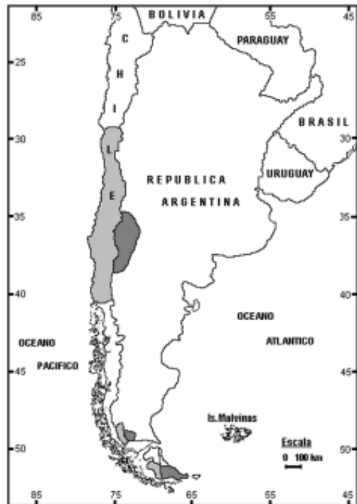
Fig. 1. Distribución actual del conejo europeo en Sudamérica (el área gris clara corresponde a Chile y la gris oscura a la Argentina).

La velocidad promedio de dispersión de esta especie fue de 16 km/año en Nueva Zelanda (Flux 1994), lo cual resulta ligeramente superior a los 10 km/año que se observó en Argen-