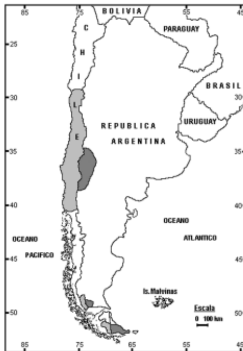
Fig. 1. Distribución actual del conejo europeo en Sudamérica (el área gris clara corresponde a Chile y la gris oscura a la Argentina).

La velocidad promedio de dispersión de esta especie fue de 16 km/año en Nueva Zelanda (Flux 1994), lo cual resulta ligeramente superior a los 10 km/año que se observó en Argen-