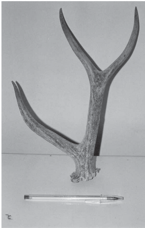
Fig. 1. Volteo de Ototoceros bezoarticus hallado en 1998. Antler of pampas deer found in 1998.

a una distancia de 100 a 300 m del ganado bovino. Transcurriendo las 17 hs aproximadamente se volvieron a detectar tres ejemplares