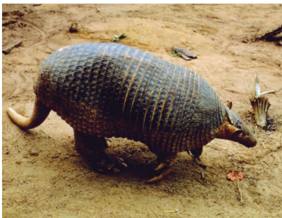
Priodontes maximus

El tatú carreta ( Priodontes maximus ) es el más grande de los representantes vivientes de la familia Dasypodidae, una familia que incluye a mamíferos acorazados conocidos como peludos, mulitas y quirquinchos. Es denominado “tatú guazú” por los guaraníes (=armadillo grande); puede alcanzar en condiciones naturales más de 1,5 m de largo total y un peso de 40 kg. Como otros miembros de su familia, su cuerpo está cubierto por un caparazón móvil formado por placas óseas y córneas, y sus dedos poseen fuertes garras curvas. Gracias a la combinación de dicho caparazón con su gran tamaño y fuerza, los adultos tienen pocos depredadores, entre los que se incluyen a los grandes félidos: el yagüareté y el puma.