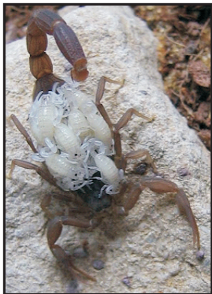
Figura 3. Hembra de alacrán con sus crías en el dorso.

Se debe tener especial cuidado cuando se revisan lugares oscuros y húmedos dentro del domicilio o cuando se examinan cajones o estantes. Es importante, asimismo, no caminar descalzo, especialmente de noche, en lugares donde exista la probabilidad de existencia de alacranes. Como última alternativa, y con el asesoramiento especializado, se pueden aplicar insecticidas de baja toxicidad por personal entrenado.