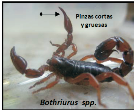
Figura 2. Características morfológicas generales de los alacranes no peligrosos. Poseen pinzas cortas y gruesas y telson con aguijón único. A modo ilustrativo se muestra una especie del género Bothriurus .