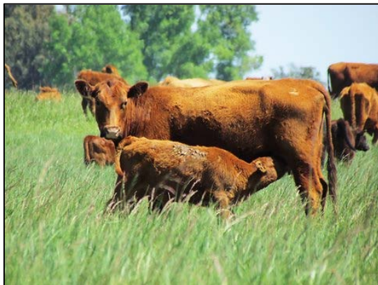
Ciclo Completo Eficiente. Una propuesta para fortalecer y aprovechar la forma de hacer ganadería en la mayoría de los pequeños y medianos establecimientos.

Son las 9 de la Mañana en Bolívar, en el centro de la provincia de Buenos Aires, unos veinte profesionales del INTA se juntan en la oficina local del instituto, es un encuentro planificado, como varios que vienen teniendo desde hace unos 6 años. Trabajan en ganadería en toda la región. Hoy tienen pensado hacer un ensayo. Harán una recorrida por un campo de la zona y se pondrán en la piel de un productor ganadero. Piensan en una nueva propuesta. Reunir a los productores en recorridas por establecimientos ganaderos de la zona para formular juntos un diagnóstico del campo visitado. Quieren ver en terreno cómo funciona la idea. Tienen un trayecto recorrido. Cuando comenzaron a trabajar juntos advirtieron que ponían en práctica acciones muy similares en distintos puntos de la provincia, decidieron potenciarlas generando propuestas en conjunto. Evaluaron la realidad productiva de la ganadería regional y afinaron una propuesta: el Ciclo Completo Eficiente. Una idea interesante y acotada para fortalecer y aprovechar la forma de hacer ganadería en la mayoría de los pequeños y medianos establecimientos. Del trabajo en equipo también nació la idea de hacer giras ganaderas. Encuentros con productores en establecimientos que ponían en práctica planteos de Ciclo Completo Eficiente en toda la región. La Gira Ganadera, así se denominaron los encuentros, tuvieron una edición por año. Desde el 2008 hasta el 2011 y participaron de ella más de 1100 productores.