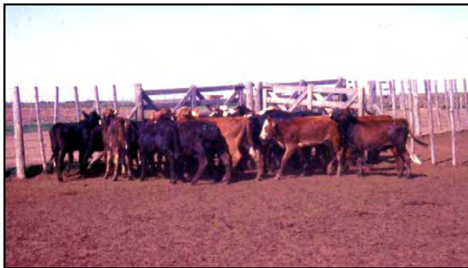
Terneros destetados 6 meses promedio