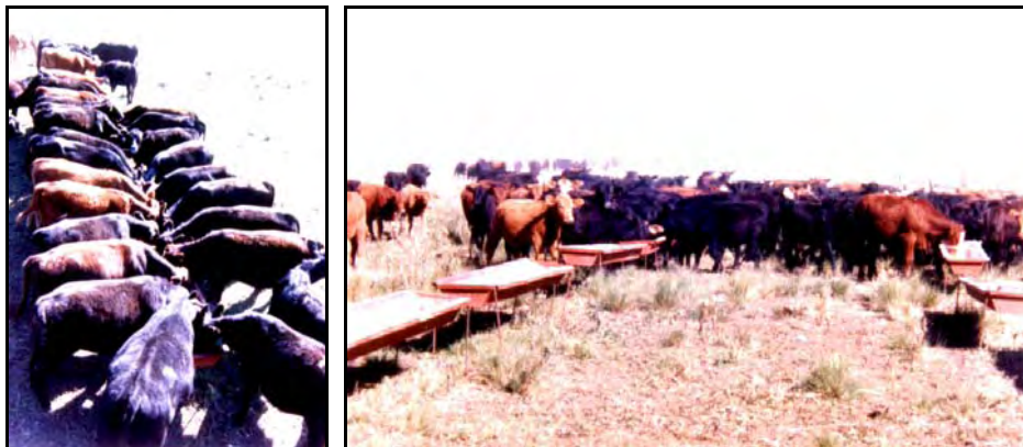
Terneros destete precoz ya acostumbrados al suplemento