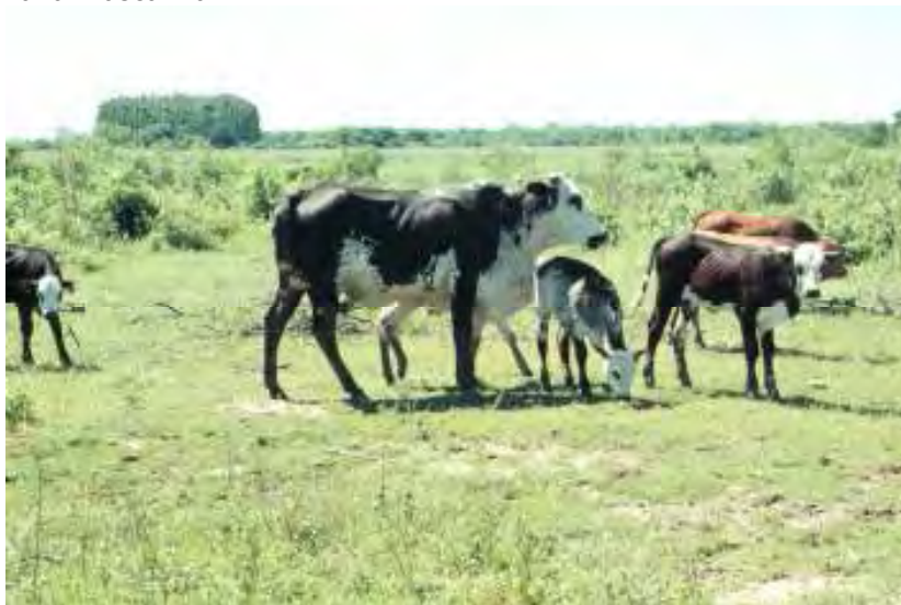
Foto 2. Los terneros "enlatados" no tienen inconvenientes para pastorear dado que se adaptan bien a la mascarilla.

El enlatado afecta negativamente la ganancia diaria de peso (GDP) del ternero durante el período del tratamiento, siendo esto más marcado en la primera semana (Tabla 1). La pérdida de peso totaliza entre 5 y 10 kg durante el período total de enlatado. La mayor reducción de la GDP en la primera semana de enlatado se produce por un mayor estrés del ternero, el cual se adapta paulatinamente a la situación a medida que transcurre el tiempo de enlatado. La baja GDP se extiende por alrededor de 2 semanas luego de retirada la lata. Este hecho puede relacionarse a trastornos digestivos (diarrea) al reiniciar la dieta láctea y/o a una menor producción láctea. Esta menor ganancia de peso durante el período de enlatado se observa tanto en vacas primíparas, como en pluríparas (18).