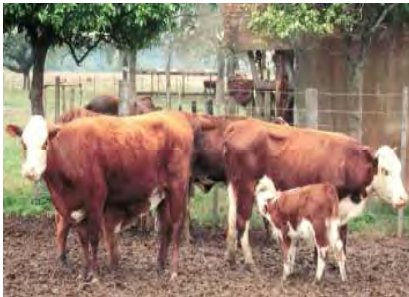
Foto 3. Ternero en posición típica de amamantamiento (colocado a 45°). Este ternero tiene una edad adecuada para ser enlatado o sometido a destete precoz.

de enlatado por 14 días para lograr un efecto positivo sobre el porcentaje de preñez. Trabajos llevados a cabo en TAES Beeville han demostrado la importancia que tiene la percepción de la vaca de ser amamantada por el ternero propio para el mantenimiento del anestro posparto (19). Los frecuentes intentos de amamantamiento durante la primera semana colocan al ternero en la posición paralela reversa o perpendicular, lo cual produciría el mismo efecto que un amamantamiento real (Foto 3). Esta situación se revierte durante la segunda semana con la disminución de los intentos de amamantamiento, lo cual simularía una situación semejante a la del destete real.