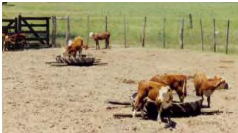
Foto 4. Terneros de destete precoz durante el período de 10 días de acostumbramiento a corral.

El destete precoz es un sistema que se basa en el destete del ternero a temprana edad, normalmente entre los 60 a 90 días de edad (7). Esta metodología incluye un período de corral para acostumar a los terneros al consumo de balanceados (10 días; Foto 4). Posteriormente, los terneros pueden continuar sobre pasturas con suplementación o terminarse en engorde a corral como ternero "bolita" (Foto 5).