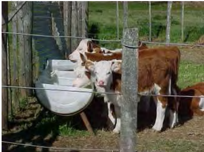
Foto 6. Terneros destetados a los 30 días de edad durante el período inicial de de acostumbamiento

Es necesario aclarar que este destete a los 30 días posparto requiere un esquema especial de alimentación que incluye un mayor período de corral (15 días) y el uso de alimentos balanceados especiales (9). A pesar de ello, estos investigadores han demostrado que se pueden lograr buenas GDP y niveles de producción postdestete adecuados en terneros destetados a los 30 y 60 días de edad (Tabla 8).