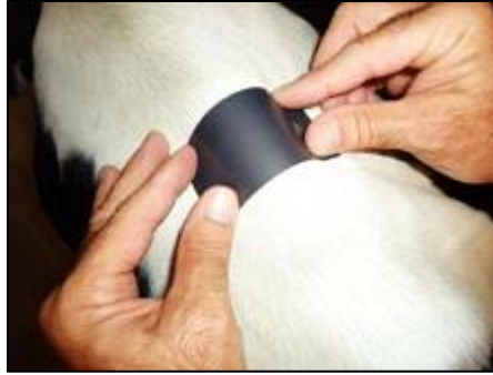
2. Coloque la etiqueta sobre el animal