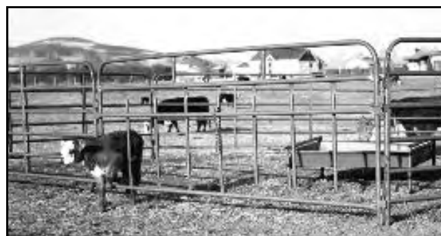
Figura 2.- Escamoteador tipo mecánico, en paneles de caño, desarmable y transportable.