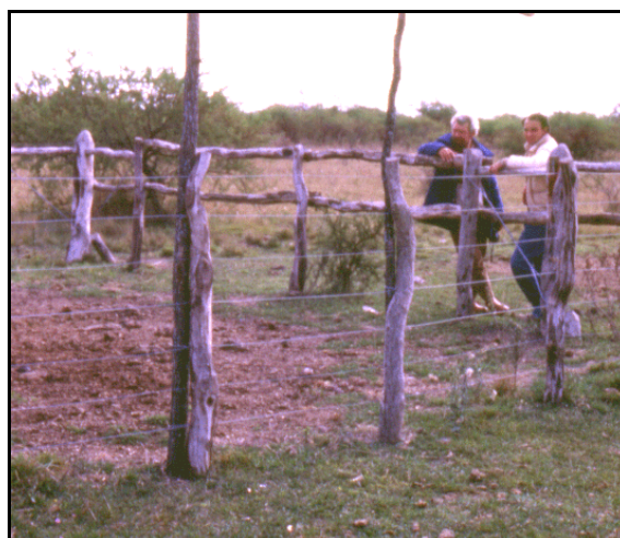
Figura 4.- Escamoteador construido con alambre, mostrando la amplia entrada para los terneros (todo un lado del corral), protegida de las vacas con troncos de eucalipto colocados horizontalmente