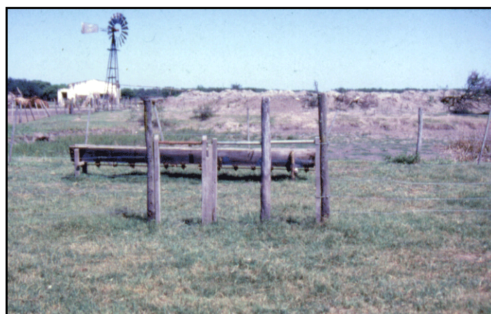
Figura 3.- Escamoteador construido con alambre; un caño horizontal impide la entrada de las vacas pero permite la de los terneros; dentro del comedero, construido con un cajón de sembradora en desuso.