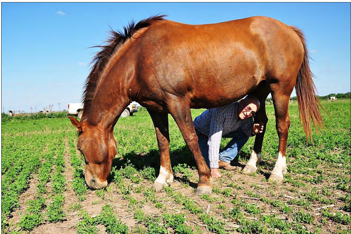
El autor de este artículo demostrando la confianza que se puede obtener de un animal.

Volver a: Instalaciones para bovinos en general