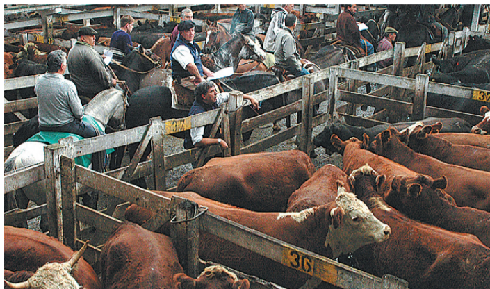
La terminación deficiente es castigada por el mercado

En la invernada de campo, el profesional destacó dos grandes fallos en el