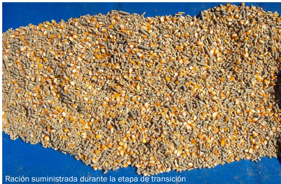
Ración suministrada durante la etapa de transición

La ganancia diaria fue sumamente positiva para toda la experiencia con valores superiores a 1,2 Kg de ganancia diaria. Lo valores se calcularon desde la salida de la estaca hasta la faena. Durante los primeros días de corral, hasta alrededor de los 130 Kg, las ganancias de peso fueron inferiores a 1 kg/día. Esto significa que en los momentos finales del ensayo las ganancias fueron cercanas a 1,5 kg o incluso superiores. No se incluyó el desbaste durante este análisis.