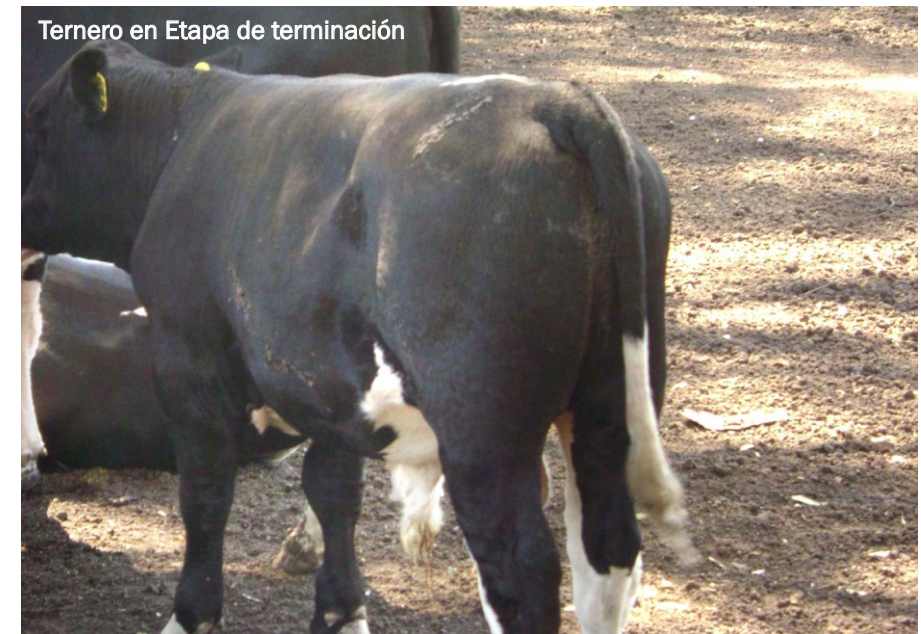
Ternero en Etapa de terminación

Desde el punto de vista de la rotación de capital y la posibilidad de darle valor agregado a un subproducto del tambo, esta experiencia resultó viable. Ajustando la escala de producción y siendo más eficiente en la primer etapa de recría (guachera), la alternativa resulta rentable a pesar de la actual relación desfavorable grano-carne.