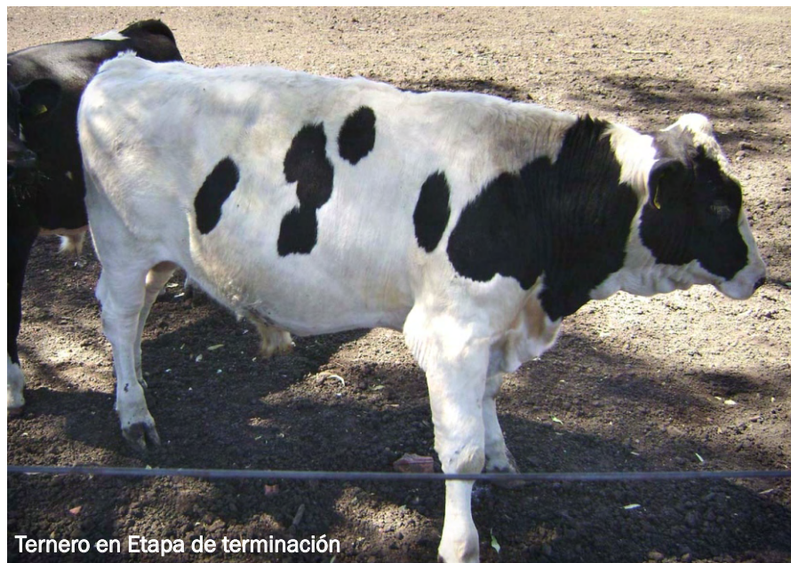
Ternero en Etapa de terminación

Los costos de Mano de obra son sumamente variables con la escala de trabajo, deberían ser menores para un mayor número de terneros. El costo del ternero al salir de la guachera depende del costo de oportunidad de venta de la leche de descarte, de cuantos terneros atiende el mismo “guachero” y del valor de mercado del ternero.