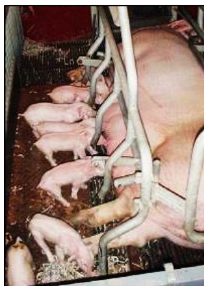
La calidad y la cantidad de calostro que recibe el lechón durante sus primeras horas de vida (6-24 h) es uno de los puntos críticos más importantes para su salud.

pasiva de gran relevancia en estos momentos en los cuales el sistema inmunitario del lechón está completando su desarrollo.