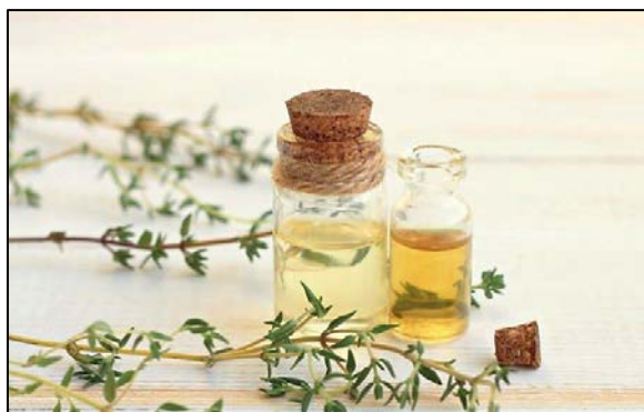
Aceites esenciales como el carvacrol o el timol poseen un gran potencial antimicrobiano y antioxidante.

Los extractos vegetales están formados por gran cantidad de sustancias que se obtienen de plantas o que pueden ser incluso sintetizadas, pero con una composición variable según su origen o el método utilizado para su obtención. Una de las principales propiedades de estos extractos vegetales es su función antiinflamatoria al suprimir la producción de citocinas inflamatorias en los macrófagos 24 . Estos extractos pueden ser ricos en aceites esenciales como el carvacrol o el timol, que poseen un gran potencial antimicrobiano y antioxidante. Uno de los inconvenientes que tienen estos aceites es la rápida absorción en las primeras secciones del TGI, por lo que es necesario protegerlos para que alcancen los tramos más posteriores donde ejercerán su acción bactericida 9 . También existen extractos vegetales que no son aceites esenciales como los obtenidos del ajo o de los cítricos, que poseen también un gran potencial antimicrobiano.