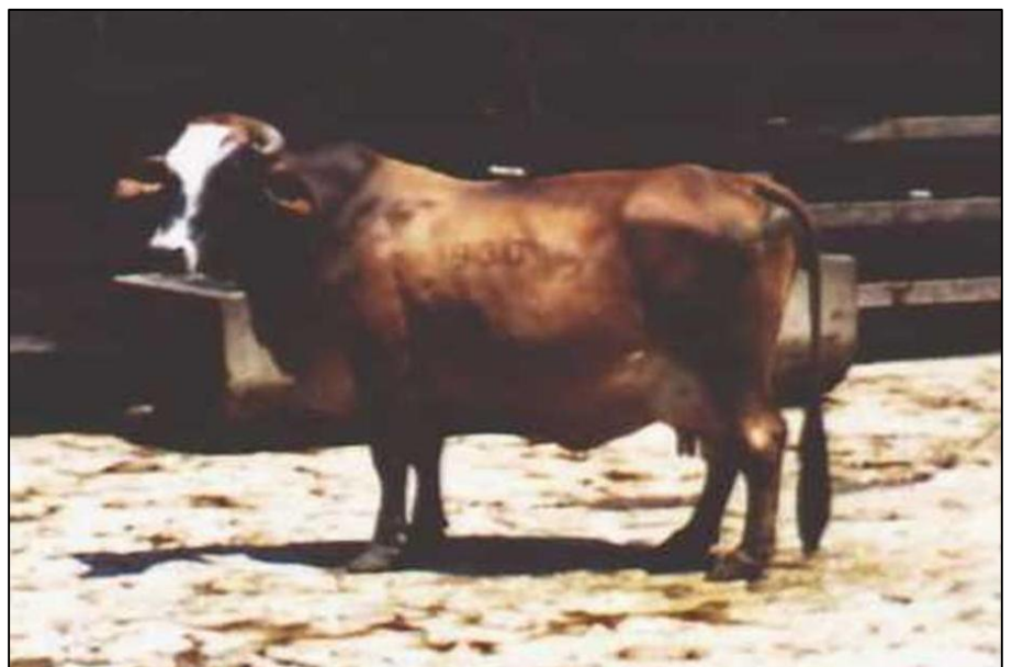
Figura 3. EJEMPLAR DE MEDIANO TAMAÑO EN UNA FINCA DE DOBLE PROPÓSITO DEL ESTADO TRUJILLO

Por su docilidad y tamaño su explotación es más económica, aunque los cuidados son muy parecidos al del ganado normal, su explotación económica incluye la producción de leche y carne, así como para la exhibición turística y particularmente como animales mascotas; por sus peculiaridades se viene incrementando su utilización para la producción de carne ecológica o producto natural, de gran demanda en el mercado.