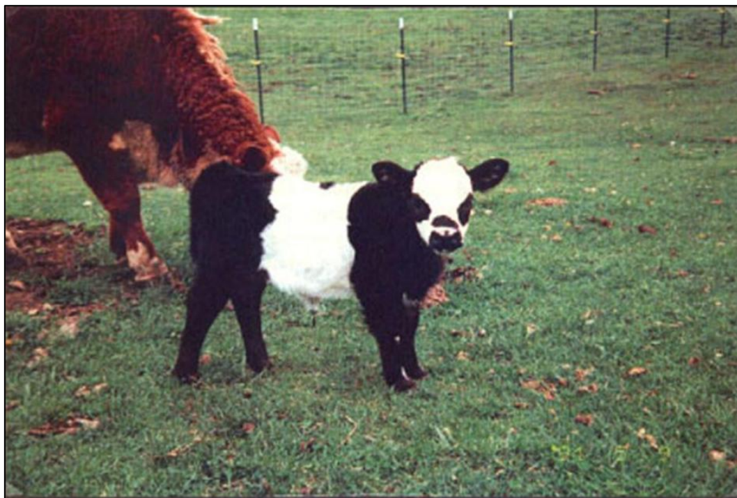
Figura 4. BOVINO MINIATURA RAZA PANDA

- http://www.minicattle.com , consultada el 05-04-2007