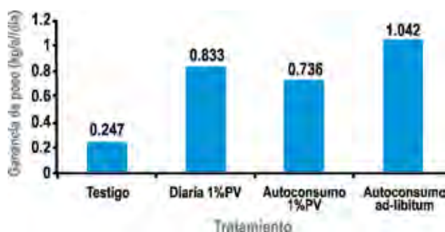
Figura 3 - Desempeño productivo de novillos suplementados con distintas estrategias de suministro de ración en una pradera sobre rastrojo de arroz.

En el promedio de varios ensayos realizados en INIA Treinta y Tres, a igual nivel de consumo de ración (1% PV) es de esperar una reducción en la ganancia diaria de peso en el rango de 5-20% en animales suplementados en autoconsumo (10% NaCl) comparado con aquellos suplementados diariamente. Por el contrario, cuando se compara la suplementación diaria al 1% PV con el autoconsumo ad-libitum, la ganancia de peso es mayor en los animales suplementados en autoconsumo simplemente debido a un mayor consumo de ración. Aunque como se mencionó anteriormente, esa mayor ganancia es a expensas de un desmejoramiento de la eficiencia de conversión de ración a peso vivo.