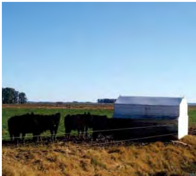
Se trata de evitar que el nivel de consumo de sal (NaCl) en autoconsumo supere el 0,10-0,15% del peso vivo por día.

La peor eficiencia de conversión en autoconsumo se debe a características propias de la tecnología de autoconsumo y a factores intrínsecos asociados al alto consumo de sal. El exceso de sal debe ser procesado y eliminado a través de la orina con un costo metabólico que incrementa los requerimientos de mantenimiento. Además, aunque existen resultados contradictorios en la literatura internacional, un elevado contenido de sal en el rumen puede afectar la digestibilidad de la materia seca consumida, afectando el aprovechamiento de los nutrientes ingeridos.