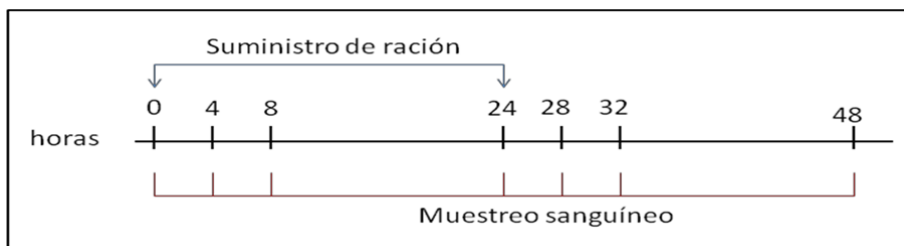
Figura 2. Representación esquemática de muestreo sanguíneo del Experimento 3.