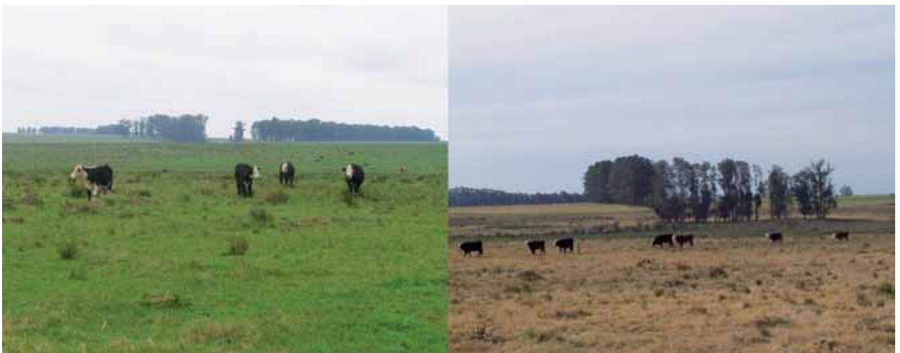
Figura 3 - A la izquierda, campo natural “verde” con baja respuesta animal al agregado de proteína en el grano de sorgo. A la derecha, campo natural “seco” con alta respuesta a la inclusión de fuentes proteicas al grano húmedo de sorgo.