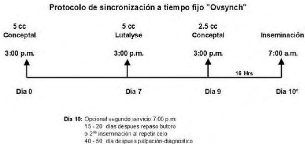
Figura 1. Diagrama del protocolo de sincronización base utilizado