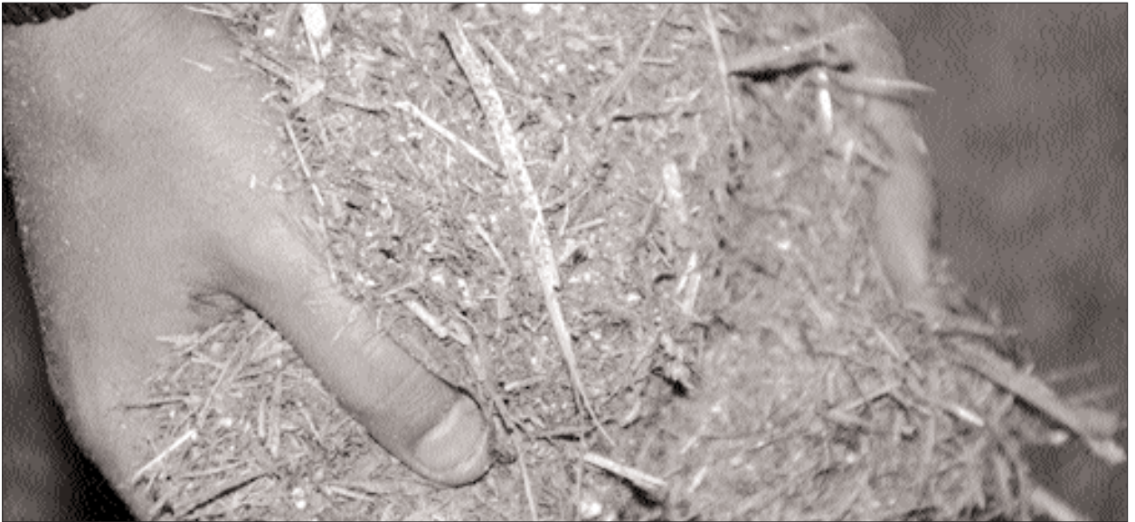
► Durante las situaciones de sequía, los kilos de carne que se producen no siempre compensan económicamente la suplementación.

presentan algunas dietas posibles de emplear en distintas categorías de animales. En todos los casos se puede usar el grano de cereal que tenga el productor en el campo o el que consiga a mejor precio. La clave es aportar una fuente rica en energía (almidón) que asegure un mejor aprovechamiento de todos los alimentos (proteicos y fibrosos) y, en algunos casos, facilitar la terminación o engrasamiento de los animales. En cuanto a la fuente fibrosa, se pueden emplear desde silajes de planta entera (maíz, sorgos, etc.), rollos de distintos orígenes, hasta rastrojos de cosecha o campo natural. Lo importante es asegurarle a los animales una cuota de fibra (el 10-20% de la dieta), aunque no sea de la mejor calidad, ya que gracias a esa fibra y si es entera (sin moler) mejor, se consigue que el animal produzca mucha saliva, y ella evitará trastornos en su salud (empachos). En lo que respecta a la fuente proteica, para los ejemplos que se presentaron en la página 79,