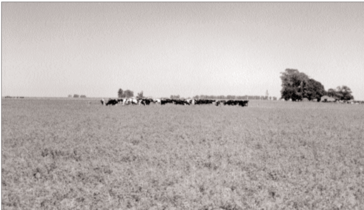
► La vaquillona en gestación suele considerarse como un animal "improductivo" y de muy bajos requerimientos, por lo cual reciben una alimentación muy pobre, con bajos niveles de energía y de proteína y a su vez excesos de fibra.

teína corregida por leche (kg/vaca/día) se observó que fue modificada por la dieta parto D2, confirmando lo observado por Ryan et al. (2003) quienes manifiestan una mayor producción de proteína láctea en vacas primíparas con altos planos nutricionales en el parto, debidas seguramente a mayores reservas corporales. Por otro lado, la adición de dietas balanceadas a sistemas pastoriles, producen un incremento potencial en la producción de proteína por vaca según Edwards y Parker (1994) y Gallardo et al (2000), coincidiendo con los resultados de este ensayo.