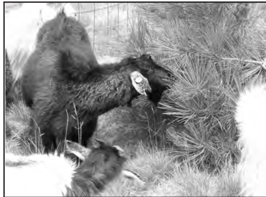
Un buen manejo silvopastoril permite que ambas actividades productivas sean compatibles.

La evolución en peso y condición corporal de las chivas no mostró diferencias significativas entre el pastoreo convencional y el silvopastoreo. Las ganancias diarias de peso mostraron una tendencia favorable hacia el silvopastoreo (Tabla 4).