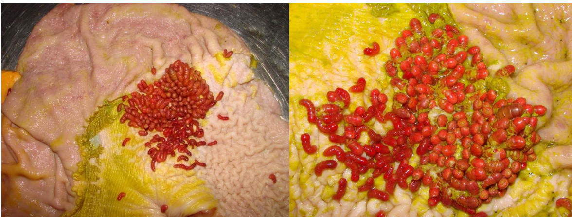
Figura 2. Presencia de Gasterophilus intestinalis en la región adyacente al margo plicatus en la curvatura menor de la mucosa escamosa. Nótese la gran cantidad de larvas de color rojizo en la mucosa escamosa.