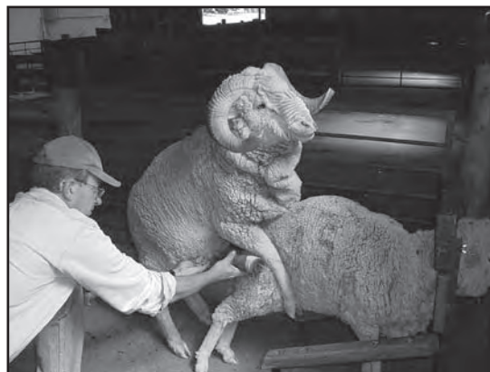
■ Obtención de semen con vagina artificial.

La inseminación cervical se llevó a cabo al momento de la detección del celo. Se colectó semen de 6 carneros Merino adultos con vagina artificial. Cada eyaculado fue mantenido en un baño de agua a 30 °C durante el tiempo de la inseminación (30 minutos). La deposición del semen se realizó con una pistola de inseminación multi-dosis (SJ Walmur, Uruguay), dosificando un volumen de 0.04 cc y una concentración entre 120-140 millones de espermatozoides totales por oveja.