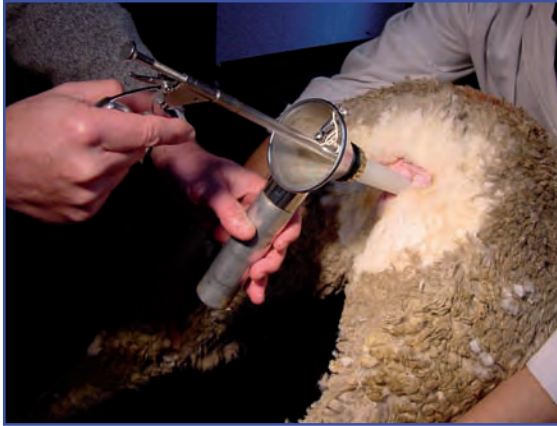
Inseminación cervical con semen fresco.

A los 30 días de la inseminación se evaluó la preñez por medio de ecografías transrectales (Aloka 500, Japón), evidenciándose una tasa de fertilidad del 48% (ovejas preñadas/ovejas inseminadas x 100).