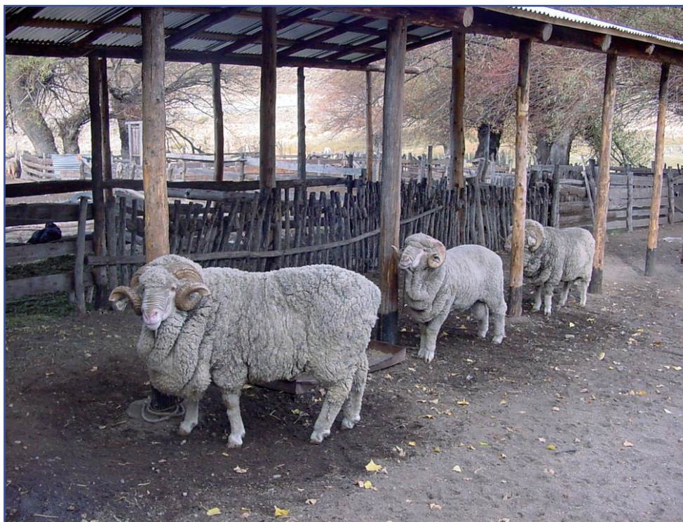
■ Machos seleccionados de alto mérito genético para la inseminación artificial.

La técnica de inseminación artificial, asociada a los métodos de sincronización de celos, está actualmente siendo utilizada como herramienta del mejoramiento genético ovino en diversos programas regionales y nacionales del INTA, así como por la actividad privada y centros de investigación nacionales e internacionales.