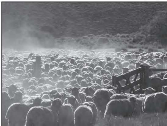
■ Encierre de la majada para la incorporación de los retajos previo a la detección de celos.

Mediante la aplicación de la IA a tiempo fijo (IATF), con posterioridad al tratamiento de sincronización de celos, se evita el encierre y mangueo diario para apartar las ovejas en estro, el manejo de los machos marcadores de celos y se reduce el tiempo de trabajo; asimismo se evita la tinción de la lana por los retajos marcadores.