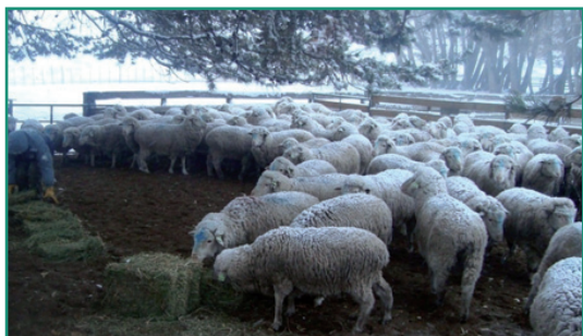
■ Foto 1: Alimentación de ovejas con fardos de alfalfa en servicio a corral.

arbustivo-graminosa con una parte de la superficie cubierta de mallín. Durante los períodos de encierre recibieron además 600 gramos diarios de fardo de alfalfa (Foto 1).