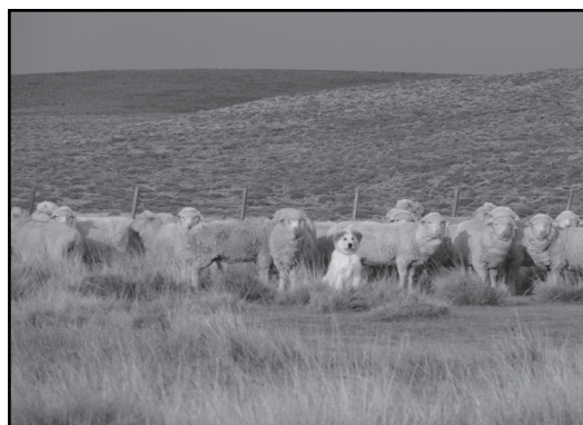
■ Foto 1: Cachorra de raza Montaña del Pirineo protegiendo a sus ovejas.

Entre los sistemas existentes de control de depredadores se destaca el uso de los perros protectores del ganado. Estos conforman un sistema de control del daño en la majada, no letal para el depredador, ya que los perros actúan por disuasión, evitando que los depredadores entren en contacto con los ovinos. La protección del ganado mediante el uso de perros se centra en la elección de la raza adecuada y el correcto proceso de entrenamiento o "impronta" del cachorro con el ganado, de tal manera que se forme un vínculo fuerte entre el perro y el rebaño (Foto 1). A pesar de que los perros no eliminan por completo los ataques, en los establecimientos que han adoptado esta práctica la disminución en el número de pérdidas por depredación ha sido efectiva.