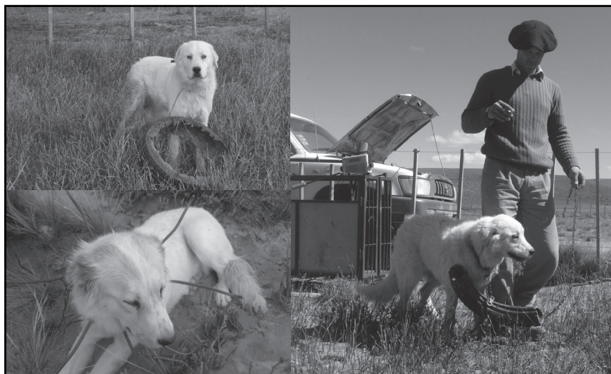
■ Foto 2: Elementos temporales para limitar el juego brusco de los cachorros con las ovejas.

medida que crecen aumentan su radio de recorrido, atravesando alambrados y campos vecinos. A veces suele suceder que puedan instalarse temporalmente con otra majada vecina.