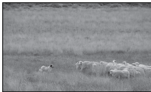
■ Foto 3a y 3b: Entrenamiento o "impronta" de cachorros protectores de ganado.

La impronta consta de dos etapas, una desde la parición de la perra hasta el final de la lactancia (45 días) que se realiza en un galpón con ovejas; y otra de socialización con los ovinos o caprinos donde cada perro es aislado con un lote de ovejas por al menos 45 días (Foto 3a). Luego de este período se encuentra en condiciones de ir al campo con su familia de ovejas (Foto 3b).