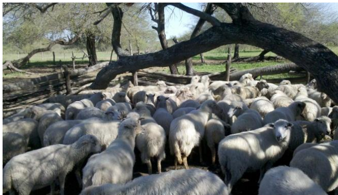
Figura 3. corral de encierre tradicional ovejas criollas formoseñas. ( Traditional holding pen on criolla sheep of Formosa ).

salen con las madres al pastoreo durante el primer mes de vida (67,7%). Los corrales no tienen la superficie necesaria de acuerdo al número de animales, ni es costumbre colocar bebederos con agua en los mismos. Sólo un bajo porcentaje suplementa a los animales en alguna época del año (25,8%). El único tratamiento sanitario que se realiza es la aplicación de antiparasitarios (65,6%).