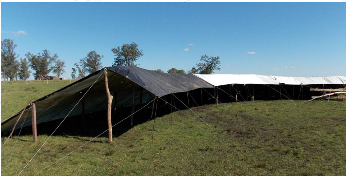
Figura 2. Obsérvese detalle de construcción de refugios de abrigo modelo "Tico" con nylon de silo, varilla de hierro, madera y alambre.