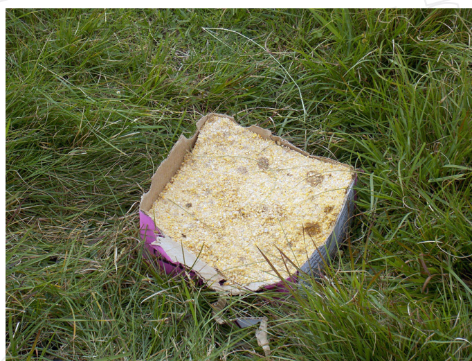
Figura 4. Obsérvese bloque preparto colocado en potrero para su consumo.