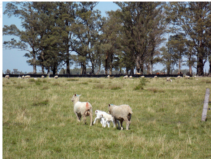
Figura 3. Obsérvese ovejas paridas y zona de confort generada por cortinas de vientos con nylon de silo al alambrado protegiendo de vientos predominantes.