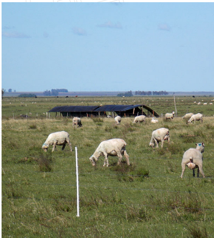
Figura 1. Obsérvese la concentración de ovejas manejadas pariendo y los refugios de abrigo modelo "Tico" al fondo.

dientes y 10% de ovejas melliceras. El estado corporal de las ovejas al parto fue de 2,8 \pm 0,2 (escala 1 al 5). Las ovejas fueron manejadas a una dotación de 10,7 ovejas/ha (8 ha/lote). Los bloques se ofrecieron a razón de 0,5 kg/oveja /día colocados diariamente debajo de las carpas de encierro. Se registró durante todo el trabajo el consumo diario de los bloques; velocidad del viento, temperatura y precipitaciones (pluviómetro); y en 3 recorridas diarias: las ovejas paridas, asistidas al parto, los corderos nacidos, abandonados, muertos en cada lote y su causa de muerte. Se buscó interferir lo mínimo posible para facilitar una buena "unión" entre la madre y los corderos. A la señalada (día 30 posparto) se registró el n° corderos vivos y el peso individual de ellos.