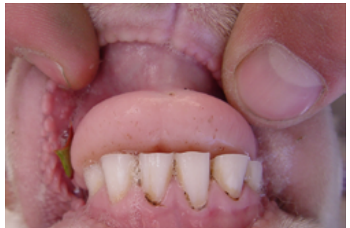
Figura 4.(a y b) Estado de la dentadura de dos animales al inicio del estudio en julio 2011