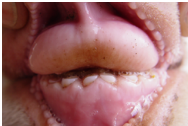
Figura 5 (a y b). Estado de la dentadura de los mismos animales al finalizar el estudio en junio de 2012