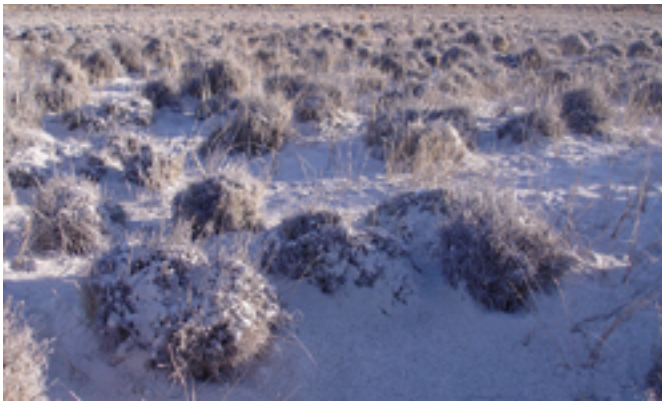
Figura 2. Acumulación de ceniza volcánica en el potrero donde pastoreaban los animales. Obsérvese el suelo y pastos cubiertos de cenizas