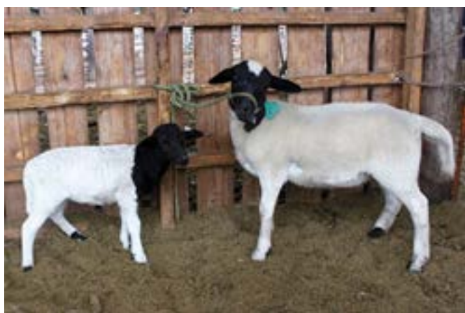
Figura 1. El animal de la izquierda había sufrido distrofia muscular nutricional y fue tratado. No murió por el cuadro pero nunca pudo recuperar el tamaño de sus compañeros. Ambos animales en la foto, habían nacido el mismo día con el mismo peso de nacimiento