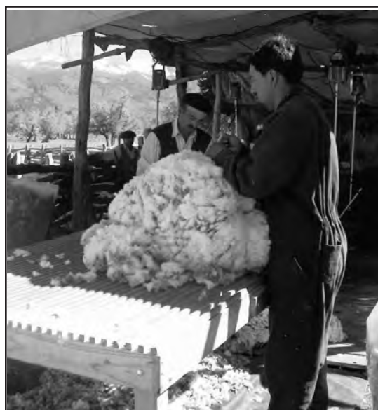
■ Comparsa de Accan acondicionando lana

* "Programa de Incentivo para la Producción Ganadera Neuquina", creado mediante Ley provincial N° 2367 del año 2001, define el traslado de los beneficios que generan los recursos no renovables al desarrollo y subsidio de las actividades productivas"