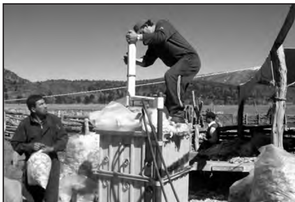
Comparsa de Accan enfiando en Ñorquinco

A los técnicos e instituciones que trabajamos en conjunto con las organizaciones nos facilita nuestro trabajo y nos permite repensar permanentemente y mejorar nuestras estrategias de intervención.