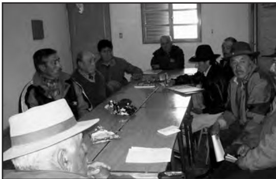
Socios de Accan planificando la esquila y precios de la lana

El proceso organizativo, a medida que transcurrió el tiempo, se fue consolidando, creciendo en número de asociados y cantidad de lana y mohair acopiado. En tal sentido fueron incorporando a su trabajo temáticas diferentes de la producción ovina y caprina y participando de espacios de decisión o generando propuestas políticas referidas al sector de pequeños productores.