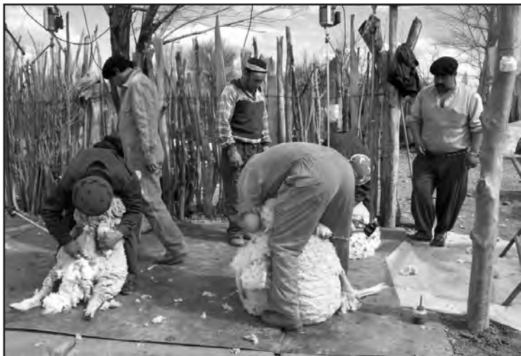
■ Esquila de Accan en Paso Aguerre

Por supuesto esto se refleja en los ingresos obtenidos, porcentualmente la diferencia entre venta en forma conjunta e individual en el año 2005 ha sido de 28 %, incrementándose paulatinamente, siendo en la zafra 2008-2009 de 57 % (ver gráfico II).