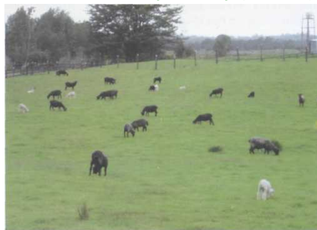
Foto 1. Distribución de ovejas en pastoreo.

Las ovejas son animales rumiantes, lo cual tiene dos grandes implicancias. Por un lado, su estómago está dividido en cuatro compartimientos distintos, donde el más grande es el rumen y contiene microorganismos que digieren la celulosa; y por otro lado, las ovejas rumian, es decir, una vez ingerido el alimento lo vuelven a llevar a la boca desde el estómago para masticarlo con los dientes de superficie plana, impregnarlo de saliva, humedecerlo e ingerirlo definitivamente para iniciar su digestión. Ambas características de las ovejas son consecuencias evolutivas, ya que sus antepasados al ser presa fácil para carnívoros que cazaban en grupo en las praderas abiertas, fueron adaptándose a comer rápidamente el pasto en grandes cantidades, para posteriormente en un sitio más seguro realizar el proceso de digestión. Esta estrategia de sobrevivencia permitió el desarrollo del proceso de rumia. La rumia es de suma importancia conductual, ya que ocurre cuando se ve a las ovejas echadas y moviendo las mandíbulas. Este momento es crucial en el proceso alimenticio y es muy importante no molestarlas y menos