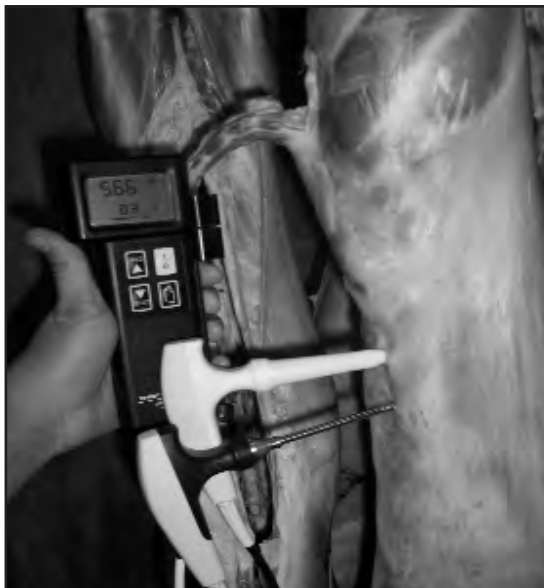
Medición de pH

- Color: Es probablemente el primer factor que considera el consumidor en el momento de adquirir carne. En general se asocia "carne oscura" con "animales viejos", y si bien algo de cierto hay en esa suposición, la realidad es que tanto animales de mayor peso, como las razas adaptadas a condiciones ambientales extremas tienden a presentar carnes más oscuras y con mayor índice de rojo. La alimentación del animal en algunos casos puede afectar el color de la carne. Por ejemplo, es sabido que la carne proveniente de animales lactantes es más clara y presenta menor índice de rojo que la de aquellos que se encuentran en pastoreo. El agregado de ciertas sustancias, como antioxidantes naturales a la dieta permite que el color de la carne se mantenga estable durante un mayor período. El color puede ser medido instrumentalmente con colorímetros u espectrofotómetros, aunque también se pueden utilizar patrones fotográficos.