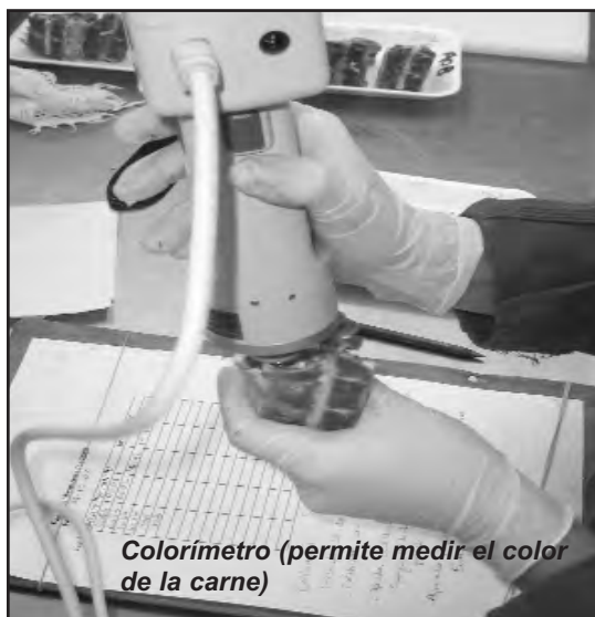
Colorímetro (permite medir el color de la carne)

De acuerdo a esto, es necesario entonces conocer cuales son los factores que afectan a este parámetro: En general se asocia "carne de animales viejos", con "carne dura". La explicación que tiene esa suposición se debe al entrecruzamiento de las fibras de colágeno que ocurre en los músculos a medida que el animal se va desarrollando. También hay otro factor: la grasa. A mayor contenido de grasa intramuscular, es mayor la terneza (con los dientes cuesta menos cortar grasa que carne), y esto podría modificarse con la alimentación que reciba el animal.