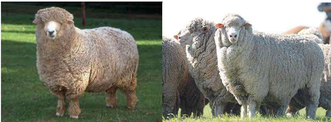
Figura 6. Raza Ideal. Gualeguay, provincia de Entre Ríos

Desde el punto de vista productivo, se la clasifica como de aptitud dual, lanera prioritariamente. De vellón cerrado, lana tipo cruza, con finura entre fina y cruza fina (23 a 26 micrones) (Lynch et al. , 2009).