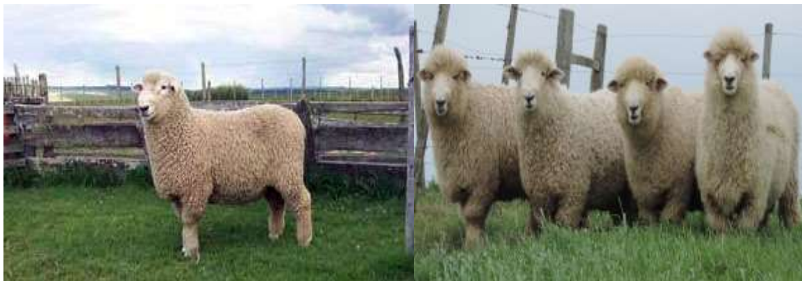
Figura 5. Raza Romney Marsh. Cacharí, provincia de Buenos Aires

Su gran difusión fue en Nueva Zelanda, siendo hoy en día la principal raza de este país. En nuestro país, ingresó en 1856 y actualmente se la explota en la región del Litoral (donde representa el 20% de los ovinos) y en la región Pampeana circunscripta a la zona de la Cuenca del Salado. (Frey, 2007) Su vellón es semiabierto, con una densidad de 22 fibras/mm 2 , el diámetro de la fibra oscila entre 28-35 micrones, con un largo de mecha entre 15-20cm. Se la considera una lana del tipo cruce media (De Gea, 2007).