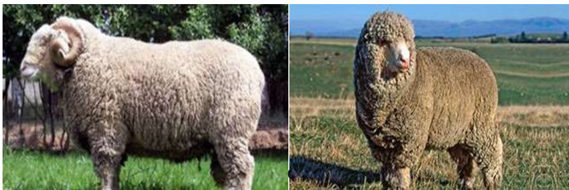
Figura 3. Raza Merino. Coronel Pringles, provincia de Buenos Aires

La raza Merino posee una gran adaptación a diferentes condiciones ambientales, en especial a zonas secas. En el país se la explota principalmente en Patagonia, donde representa el 63% de los ovinos. En esta región se la ubica en meseta. A medida que nos dirigimos hacia la zona de precordillera esta raza va siendo reemplazada por Corriedale o cruza entre ellas al posibilitar la producción de carne además de lana. En la pradera pampeana, se la explota en la zona de Coronel Pringles y sus alrededores (Mueller, 2005).