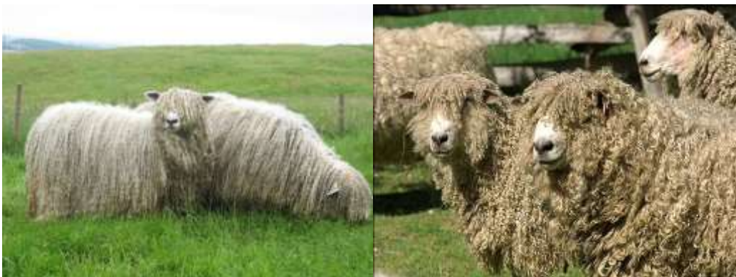
Figura 7. Raza Lincoln. Tandil, provincia de Buenos Aires