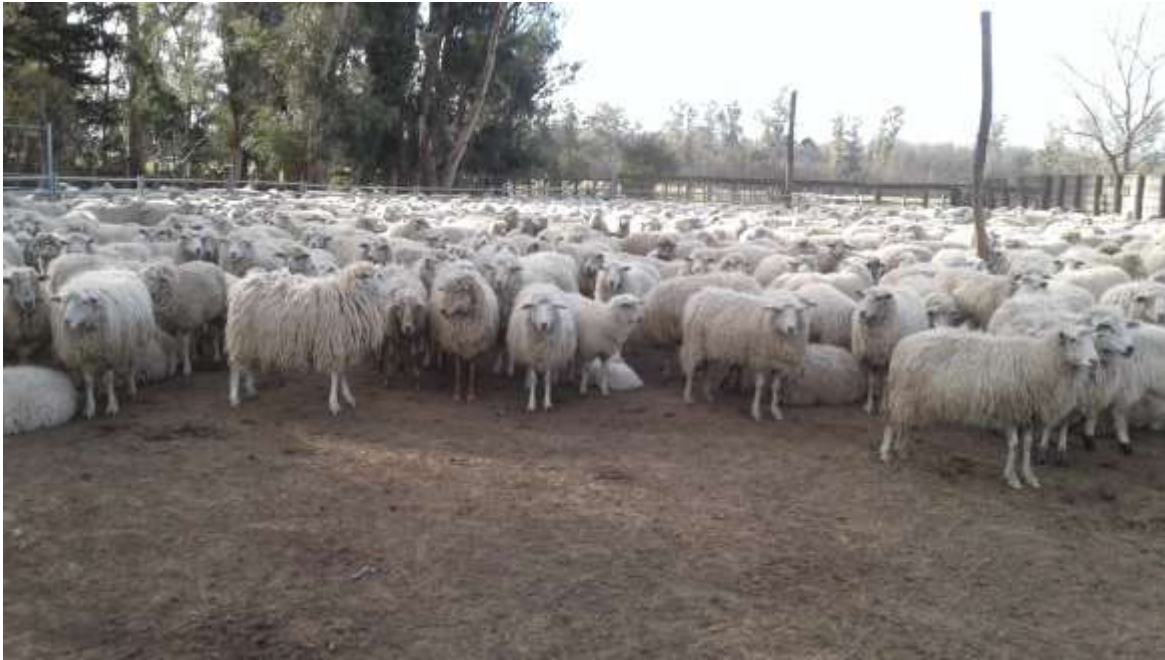
Figura 2. Ovinos criollos, provincia de La Pampa