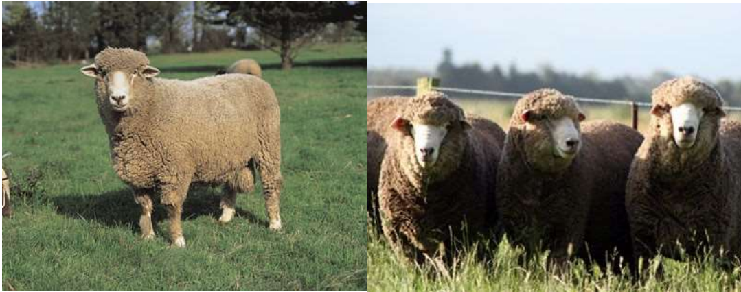
Figura 4. Raza Corriedale. Sauce, provincia de Corrientes

clasifica como cruce fina. Se adapta a ambientes muy variados en clima y altura (De Gea, 2007).