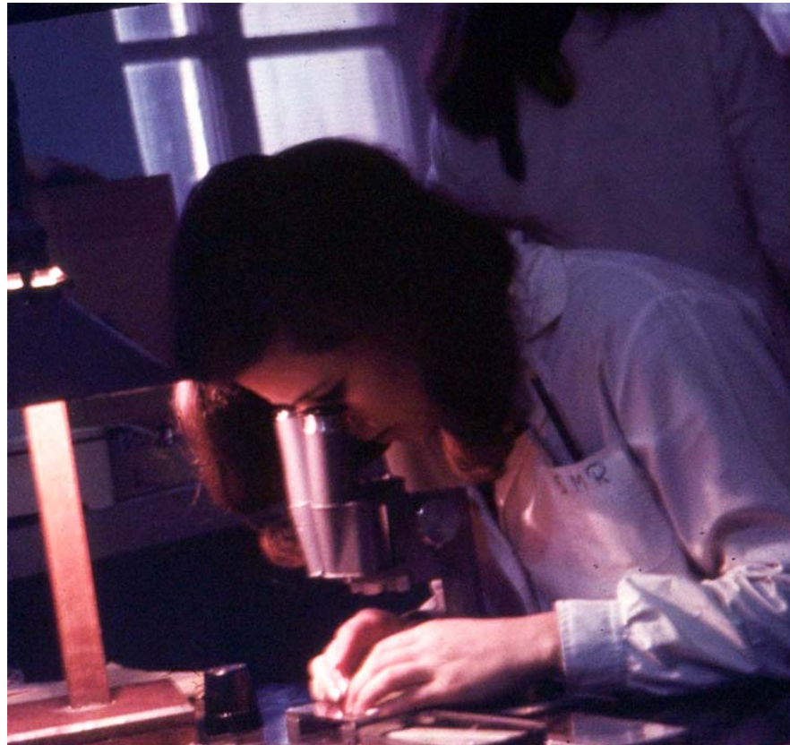
Laboratorio de Ictiología, Museo de La Plata, FCNyM, UNLP, década del 60