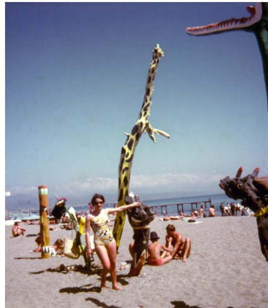
Málaga, España, 1972 Alcazaba y Torremolinos respectivamente