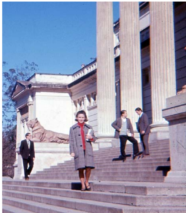
En la escalinata del Museo de La Plata, FCNyM, UNLP