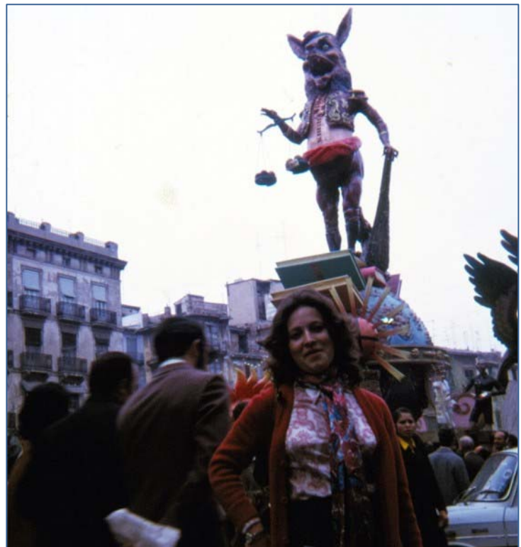
Fallas Valencia, España, 1972