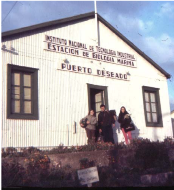
Puerto Deseado, 1967