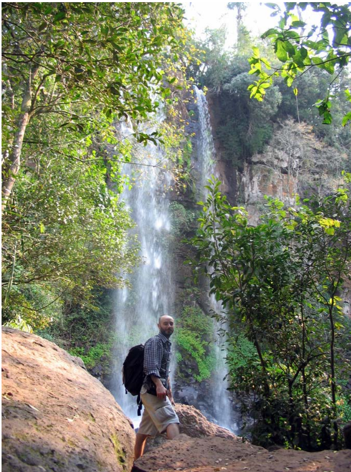
Parque Nacional Iguazú, Misiones, 2011