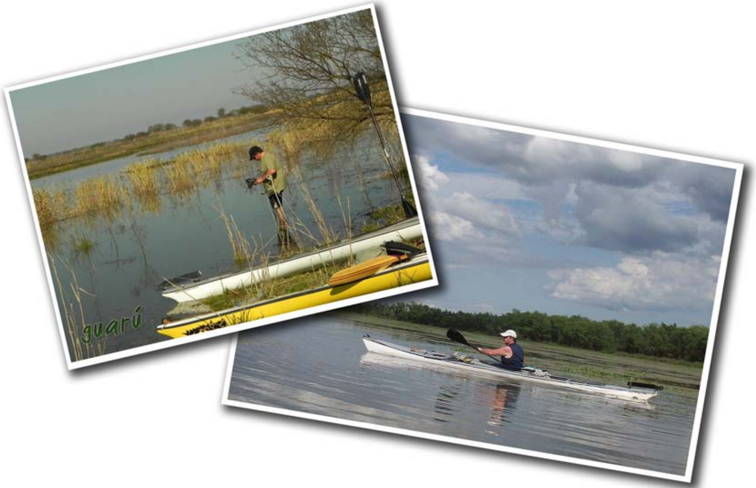
Curioseando por las islas frente a Rosario, 2013