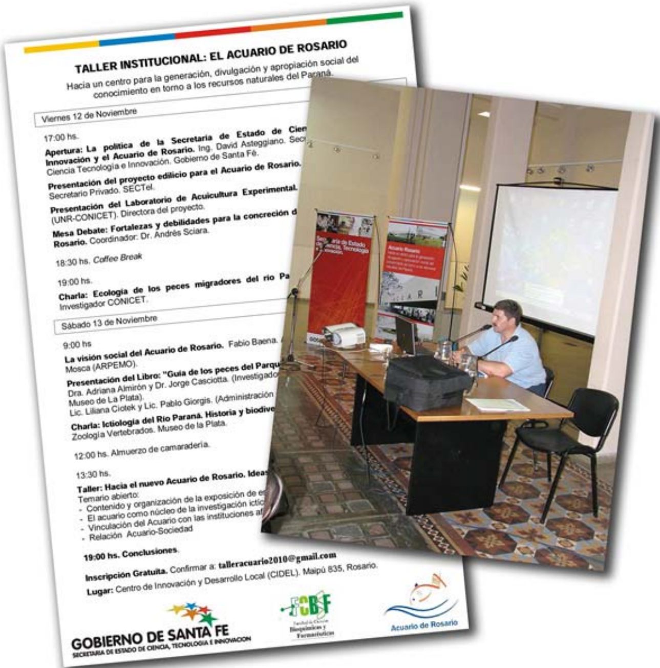
Participación en el Taller Institucional: el Acuario Rosario, 2010