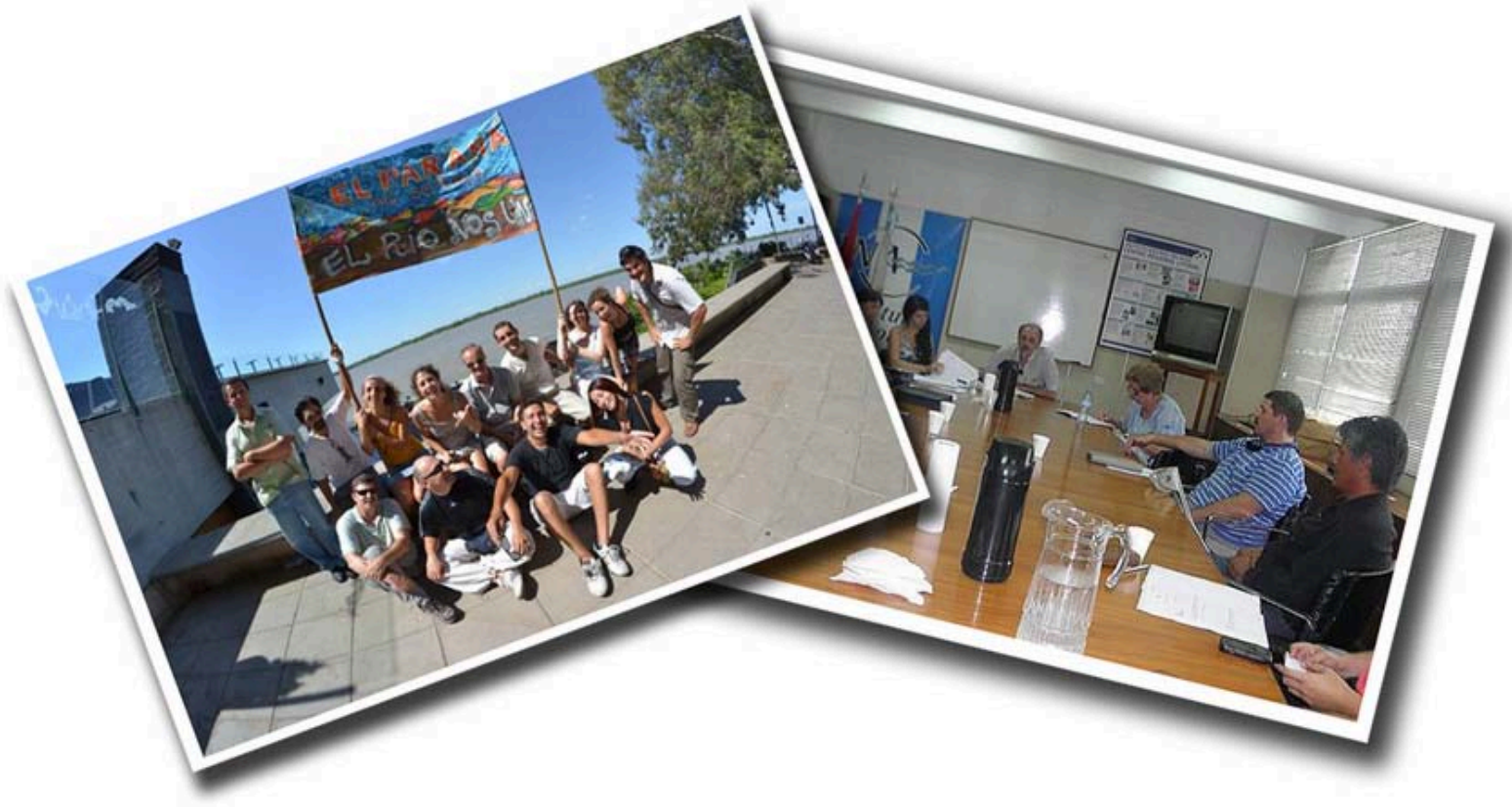
Izquierda: participación en ONG en defensa de los humedales del Paraná, 2012 Derecha: participación en el Concejo Provincial Pesquero de Santa Fe, 2013