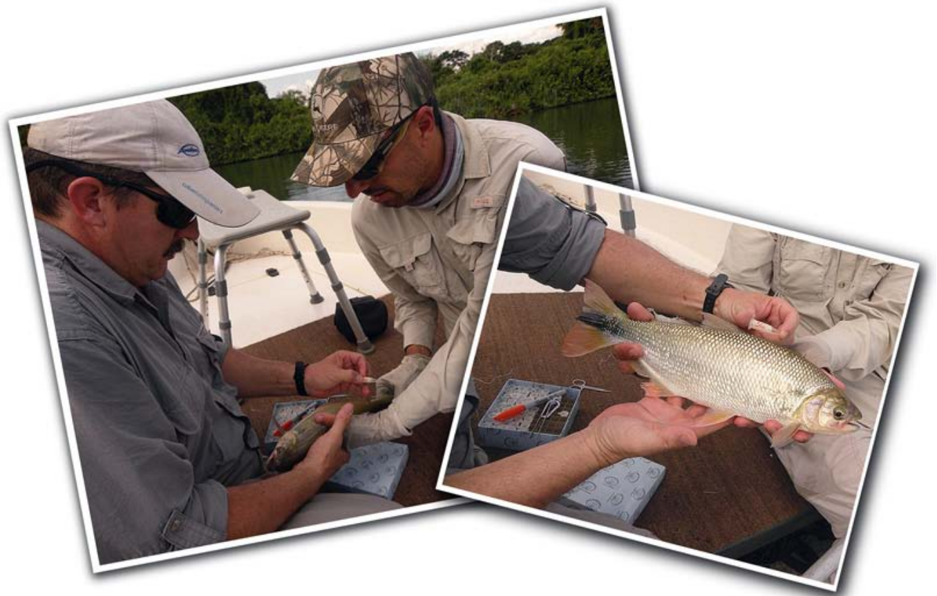
Tomando muestras de tejidos de Brycon, 2011 )