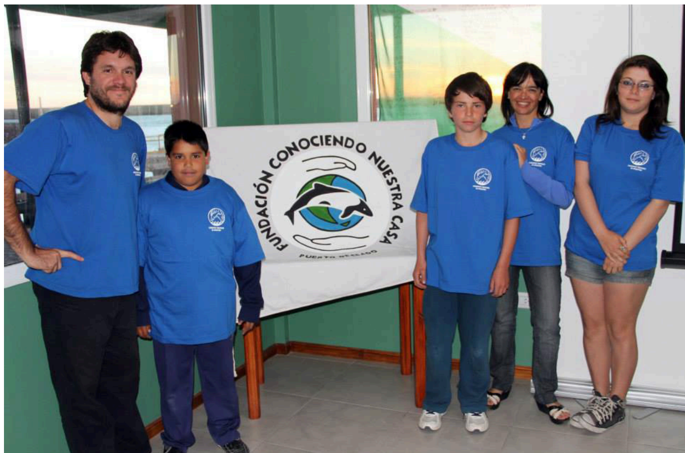
Difusión del proyecto Conservar Tiburones ; Argentina en la Fundación Conociendo Nuestra Casa, Puerto Deseado, diciembre de 2013