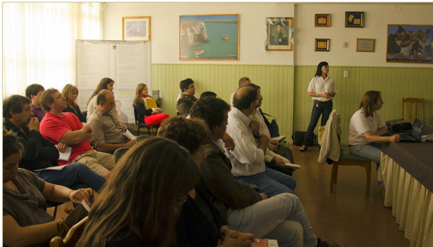
Presentación del plan de manejo de la Reserva Provincial Ría Deseado, Puerto Deseado, diciembre de 2013