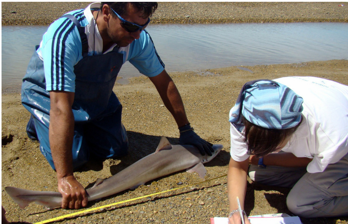
Reserva Provincial Península de San Julián, Santa Cruz, enero 2013 Monitoreo de torneo de pesca con devolución de tiburones