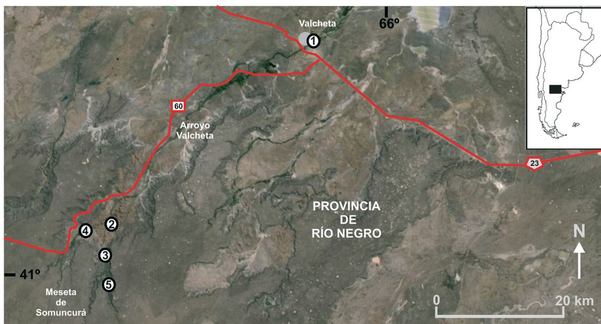
Mapa. Ubicación del arroyo Valcheta, provincia de Río Negro, Argentina. Círculos blancos: indican los sitios de muestreo. Círculo gris: localidad de Valcheta.

Durante enero y febrero de 2013 y 2014 se realizaron muestreos en cinco lugares diferentes del arroyo Valcheta. En el transcurso de estos muestreos se encontró un nuevo registro de la mojarra Cheirodon interruptus , el cual constituye el motivo de la presente nota. Este arroyo se encuentra ubicado en el sureste de la provincia de Río Negro (entre 40°34'34"S,