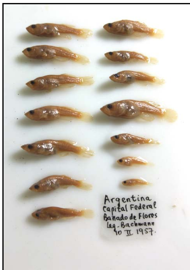
Figura 1. Austrolebias elongatus , MLP 7890, juveniles, 7,8-21,6 mm LE; Bañado de Flores, Capital Federal.