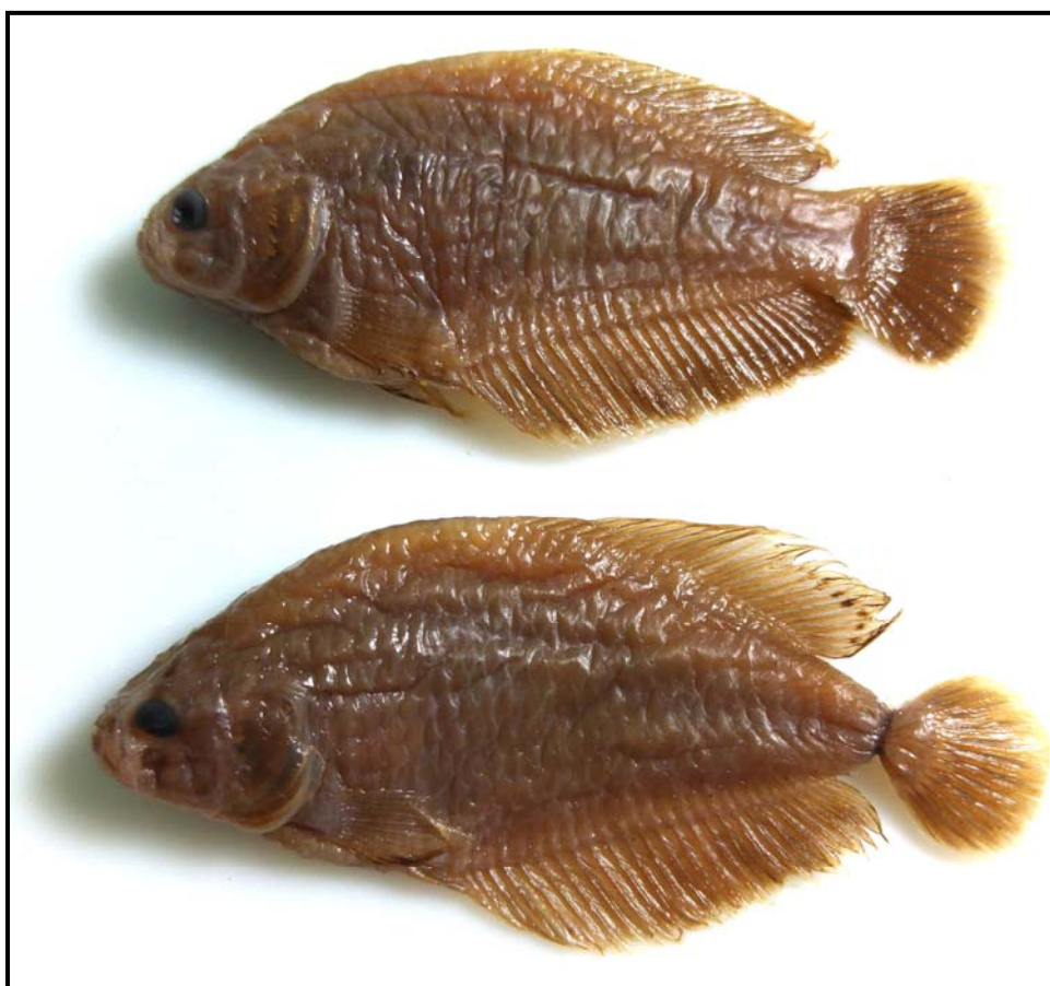
Figura 4. Austrolebias bellottii , MLP 3643, 2 machos, 39,5-49 mm LE; La Plata, Buenos Aires.