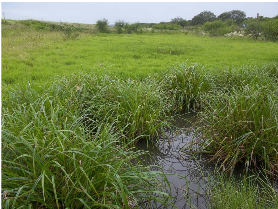
Figura 5. Ambientes temporarios de A. alexandri , A. bellottii y A. nigripinnis ; Ceibas, Entre Ríos. Noviembre 2011.