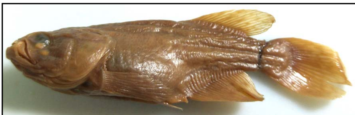
Figura 2. Austrolebias elongatus , MLP 3407, hembra, 62 mm LE; Gualeguaychú, Entre Ríos.