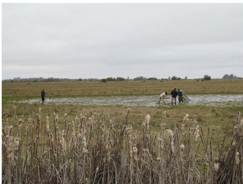
Figura 6. Ambientes temporarios de A. bellottii y A. elongatus ; Punta Indio, Buenos Aires. Agosto 2016.