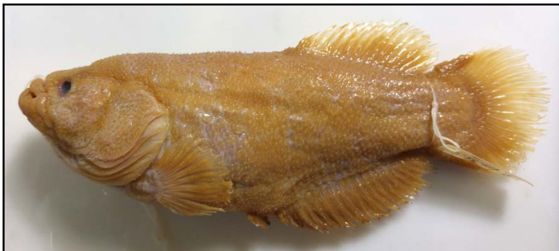
Figura 3. Austrolebias elongatus , MLP 1956, macho, 110,7 mm LE; La Plata, Buenos Aires.