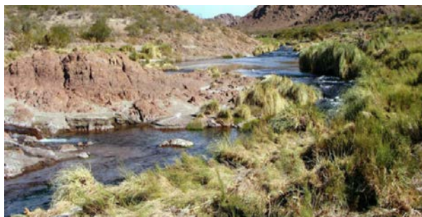
Arroyo Valcheta

Como la mayoría de los peces óseos, la reproducción de la mojarra desnuda, es de tipo ovípara y con fecundación externa. La estación reproductiva comienza en el mes de agosto hasta octubre. El dimorfismo sexual es poco notorio aunque las hembras maduras pueden diferenciarse de los machos por presentar el abdomen más redondeado. Se observó en ejemplares mantenidos en acuario que la puesta se realiza posteriormente a un cortejo de varias horas y una misma pareja puede repetir la operación en un lapso aproximadamente de una a tres horas. Los embriones recién eclosionados permanecen en el fondo adheridos a la grava hasta el comienzo de la alimentación exógena.