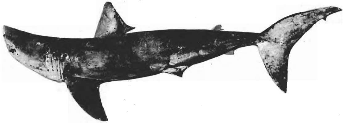
Fig. 1.— Carcharodon carcharias , ♂ 2.240 mm, Puerto Quequén.