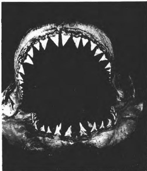
Fig. 3.— C. carcharias , ♂ 3,050 mm, Puerto Quequén, quijadas. Col. MACN N° 4544.