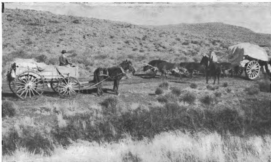
FIG. 2. — Forma en que fueron transportados los primeros embriones de salmónidos introducidos desde Neuquen hasta San Carlos de Bariloche, penosa travesía que duraba alrededor de 20 días.