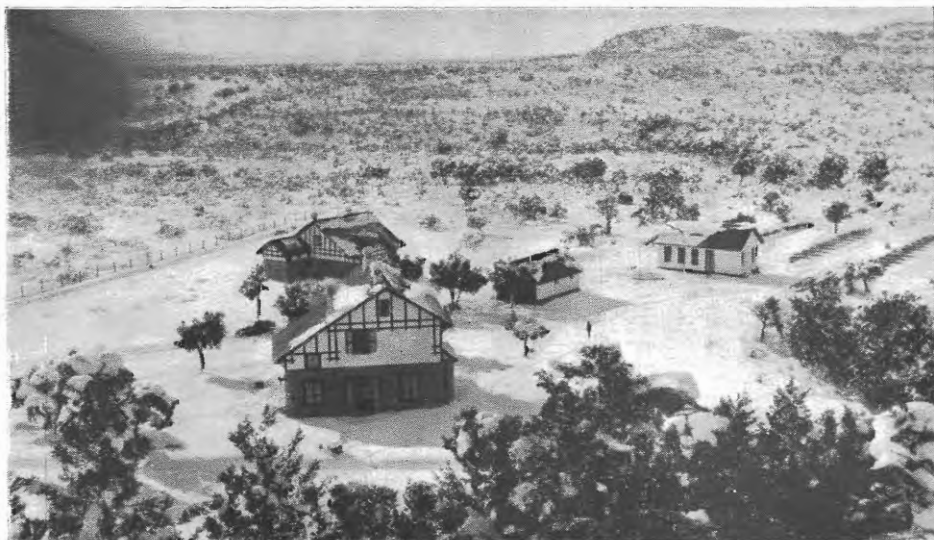
FIG. 4. — Vista del nuevo vivero de salmónidos de San Carlos de Bariloche, compuesto de casa del superintendente, casa de empleados, garage, sala de incubación con los estanques que se observan en el último plano.