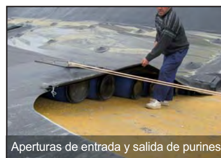
Aperturas de entrada y salida de purines