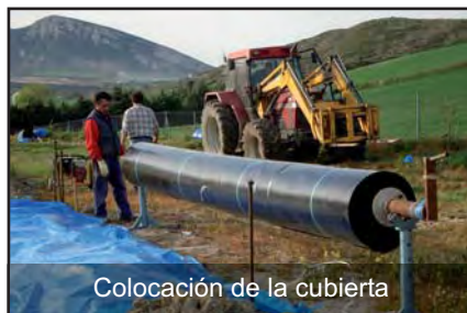
Colocación de la cubierta

Por último, la cubierta se ha dotado de ruedas de seguridad que puedan ayudar a salir a los animales que pudieran caerse en el interior de la balsa. En cualquier caso, la balsa está rodeada de una valla perimetral para evitar la entrada de animales y personas.