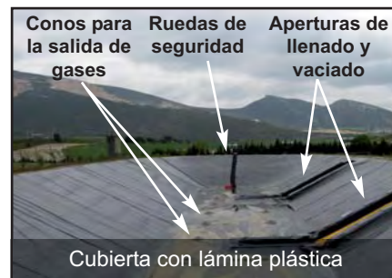
Conos para la salida de gases, Ruedas de seguridad, Aperturas de llenado y vaciado. Cubierta con lámina plástica