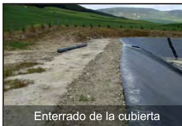
Enterrado de la cubierta