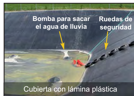
Bomba para sacar el agua de lluvia, Ruedas de seguridad. Cubierta con lámina plástica