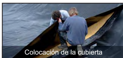
Colocación de la cubierta