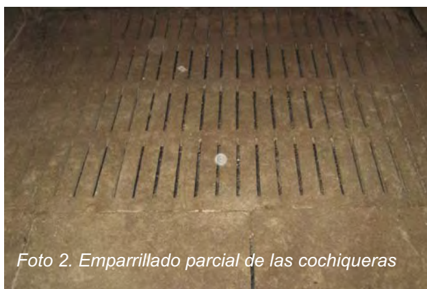
Foto 2. Emparrillado parcial de las cochiqueras

Como se observa en la revisión bibliográfica expuesta, los diversos autores indican cómo la densidad de animales y el espacio por animal son factores clave que influyen sobre los parámetros productivos. Por este motivo, entre otros, se ha realizado un estudio para comprobar, bajo unas determinadas condiciones de producción y características genéticas, los efectos sobre los parámetros productivos G.M.D. e I.C. de dos densidades de animales diferentes: un primer grupo formado por cochiqueras con 12 animales ( 0,75 \text{ m}^2/\text{animal} ) y un segundo con 13 animales por cochiquera ( 0,69 \text{ m}^2/\text{animal} ), densidades que