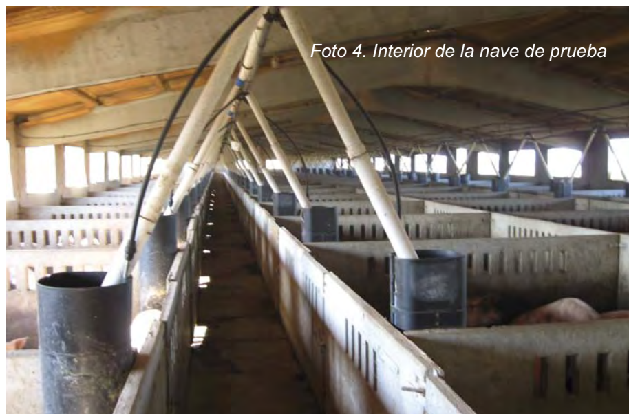
Foto 4. Interior de la nave de prueba

A las tres semanas de la entrada de los animales en el cebadero se eligieron las cochiqueras que iban a ser controladas para el cálculo de la G.M.D. Fueron un total de 30 cochiqueras, 15 de densidad 12 y otras 15 de densidad 13. De las filas centrales del cebadero fueron seleccionadas 8 cochiqueras de cada densidad y de las filas de los extremos 7 (Cuadro 1). Las cochiqueras elegi-