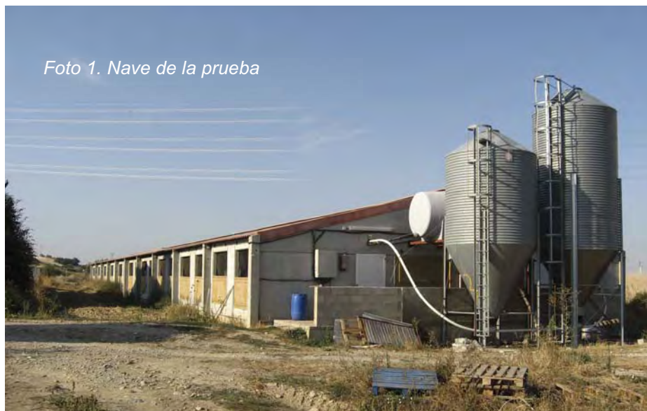
Foto 1. Nave de la prueba

respetan las normativas de bienestar animal (Real Decreto 1.135/2002). Se pretende averiguar qué evolución seguirá cada uno de estos parámetros y si se darán diferencias significativas en función del número de animales por cochiquera.