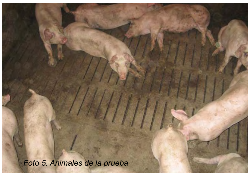
Foto 5. Animales de la prueba

se puede comprobar si observamos los pesos iniciales y finales de los animales en ambas densidades, ya que estos fueron muy semejantes (Densidad 12: peso inicial 20,00 kg y final 103,29 kg; Densidad 13: peso inicial 20,04 kg y final 101,60 kg) (Tabla 1). La