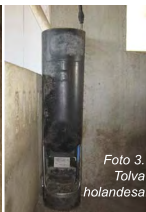
Foto 3. Tolva holandesa