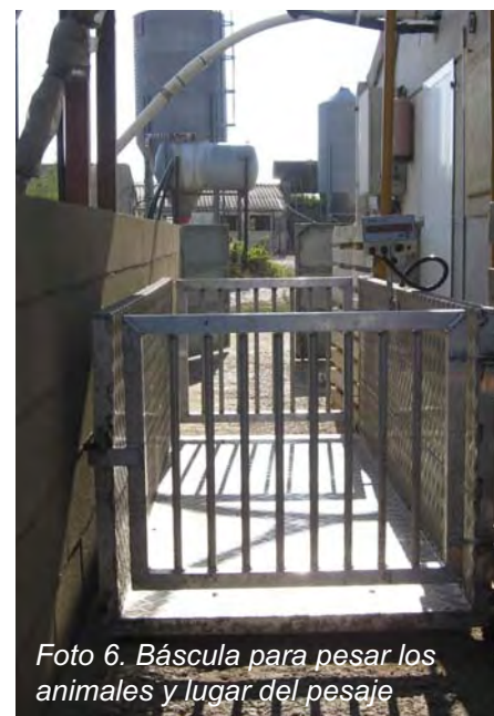
Foto 6. Báscula para pesar los animales y lugar del pesaje

cias significativas entre densidades en los diversos pesos obtenidos en las pesadas realizadas durante la prueba, a excepción de los pesos obtenidos en la cuarta pesada. En esta pesada los animales de densidad 12 tenían un peso superior (90,72 kg) a los de densidad 13