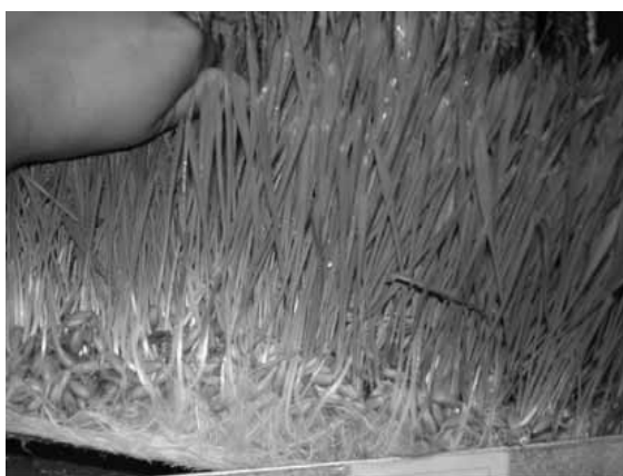
Figura 2. Crecimiento de FVH de avena a 10 DDS.

† Letras distintas entre filas indican diferencias significativas para la prueba de Tukey (p≤0,05).