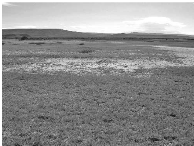
Foto 4. Sales en superficie. Valle del Río Chico