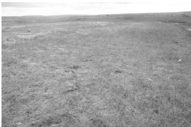
Foto 10: Mallin húmedo severamente deteriorado. Valle del Río Coyle. Nótese el alto porcentaje de suelo desnudo.