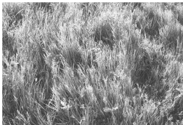
Foto 9: Mallin húmedo moderadamente deteriorado. Valle del Río Gallegos. Nótese el alto porcentaje de Acaena magellanica.