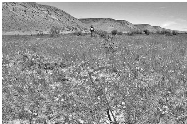
Foto 11: Mallin húmedo severamente deteriorado. Valle del Río Chico