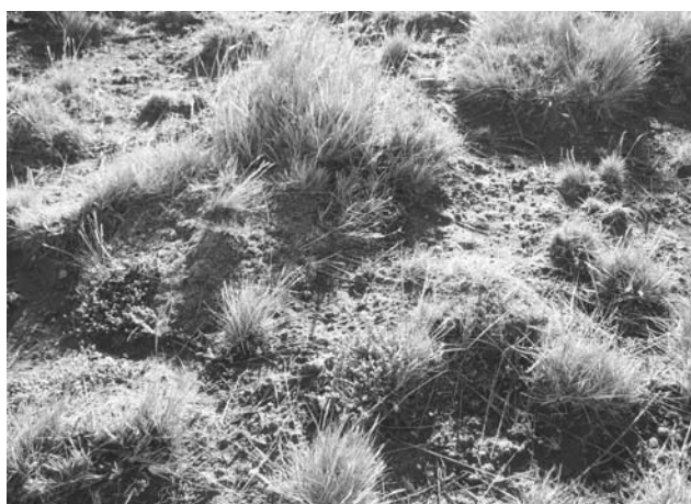
Foto 17: Mallin seco severamente deteriorado. Valle del Río Gallegos