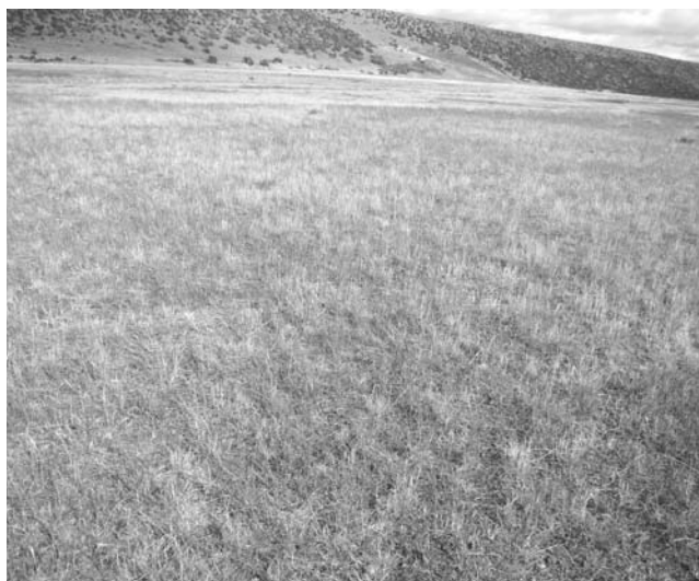
Foto 14: Mallin seco moderadamente deteriorado. Valle del Río Gallegos