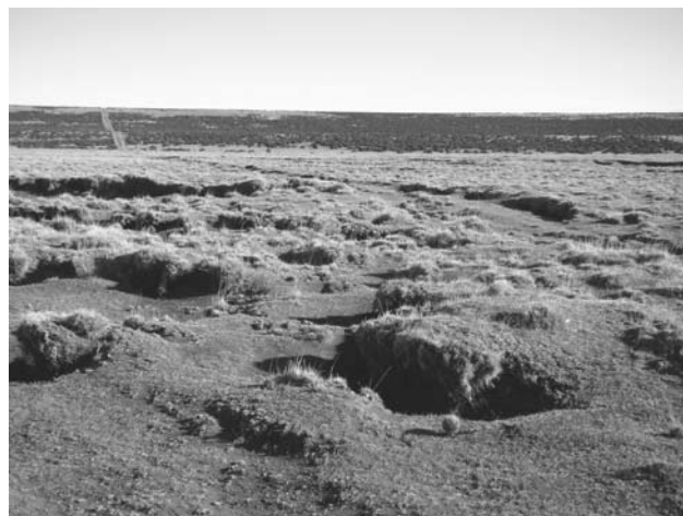
Foto 1. Cárcavas. Cañadón Deus. Estancia La Paz

- Escala de paisaje: en una apreciación visual se detectará la presencia de cárcavas (Foto 1), mogotes (Foto 2 y 3) y/o presencia de sales en superficie (Foto 4). Si estos indicadores se presentan a lo largo del mallin, el ambiente se considera en un estado avanzado de deterioro. Por otro lado, si se encuentran aislados solo significan una advertencia de focos potenciales de deterioro severo.