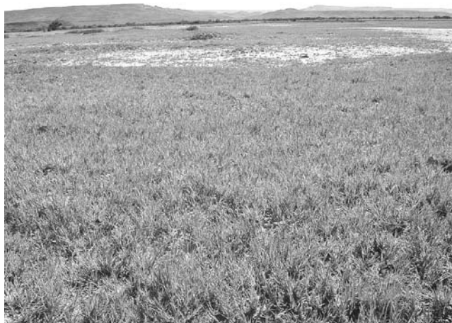
Foto 18: Mallin seco severamente deteriorado. Valle del Río Chico. Nótese el predominio de la especie indicadora Distichlis spicata .