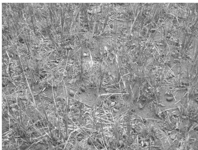
Foto 16: Mallin seco severamente deteriorado. Valle del Río Coyle