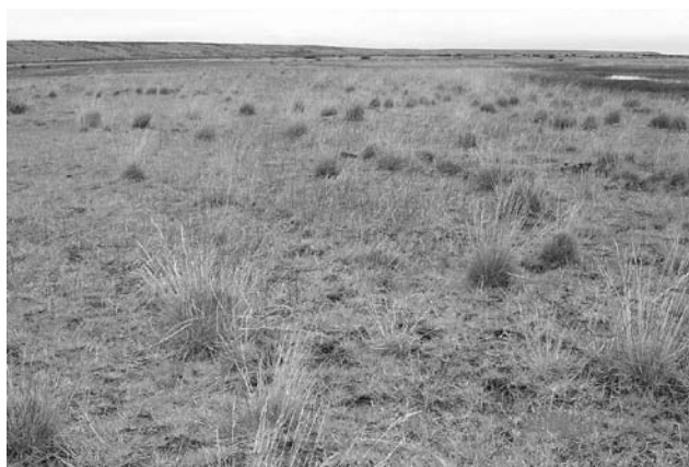
Foto 15: Mallin seco moderadamente deteriorado. Valle del Río Coyle