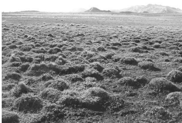
Foto 3. Mogotes con suelo desnudo. Estancia Lago Belgrano