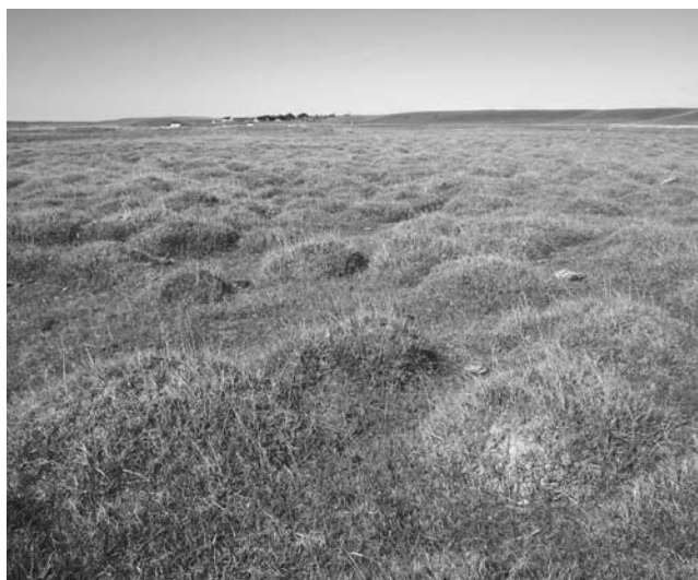
Foto 2. Mogotes. Valle del Río Coyle