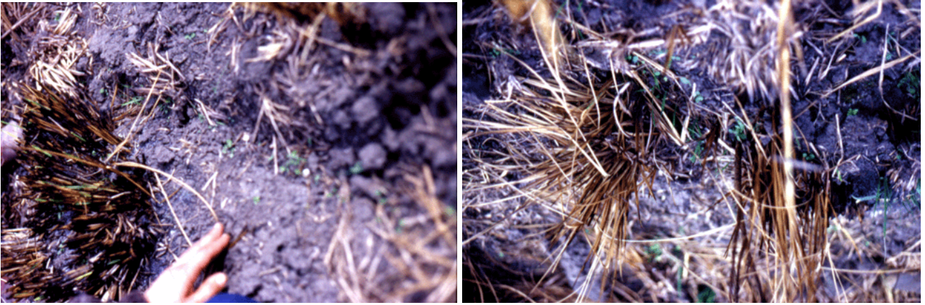
Intersiembrá lograda; naciendo. (Est. Aguada del Molle, Río Cuarto)