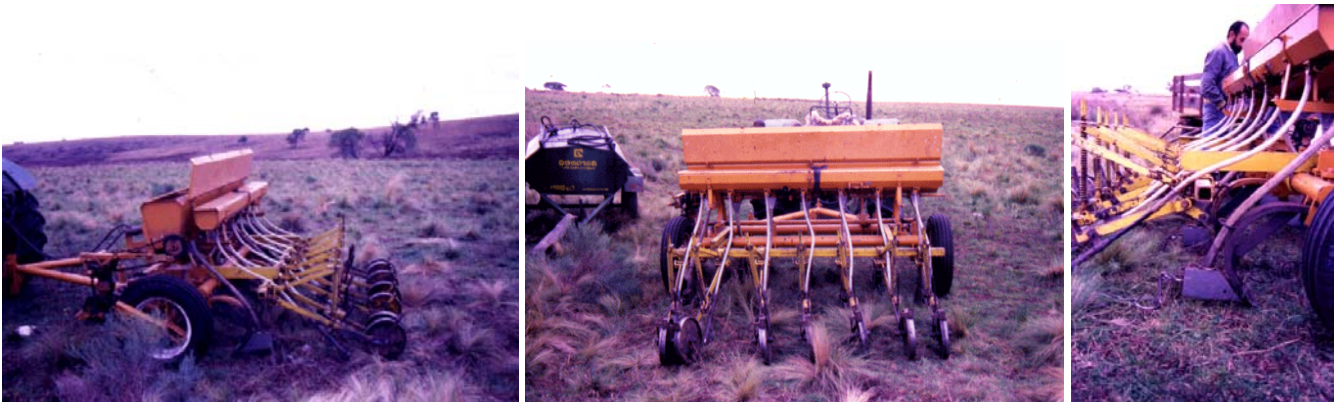
Maquina para intersementar Maracó (Establ. Aguada del Molle, Río Cuarto).